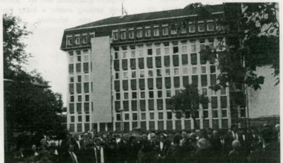
Az ünnepség résztvevői, háttérben az új sürgősségi osztály és fekvőbeteges osztályok épülete.