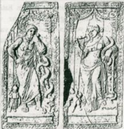
Aszklepiosz az orvoslás istenének és leányának - Hügieia - az egészséges élet istennőjének védelme alatt zajlott a tudományos gyűlés Vásárosnaményban.