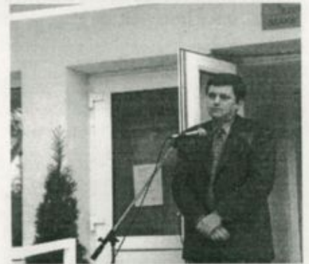
Dr. Gógl Árpád egészségügyi miniszter, ünnepi beszédét mondja.

Ezek a munkák elsőként Vásárosnaményban indultak be, és az eltelt tíz hónap alatt elkészült a főépület egy szinttel megemelt szárnya, amely helyt ad a sürgősségi betegellátásnak, a gyermekellátásnak, a belgyógyászati és krónikus osztály kétharmad részének, valamint a sebészeti részleg betegszobáinak, az ambulanciáknak.