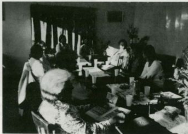
A klub tagjai az októberi összejövetelen