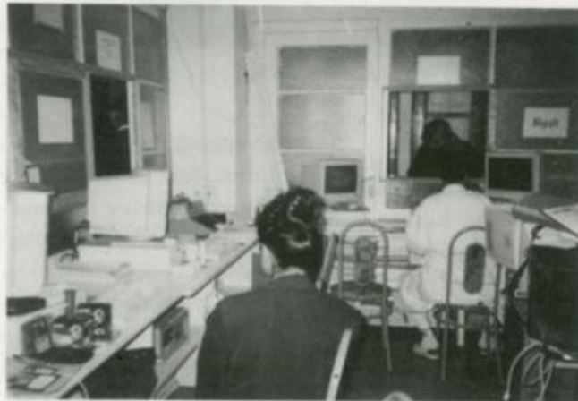
Az informatikai osztály munkatársai

földszint bal oldali folyosójáról nyíló, a korábbi állapotokhoz képest lényegesen jobb feltételeket biztosító helyiségben végezhetik munkájukat a továbbiakban.