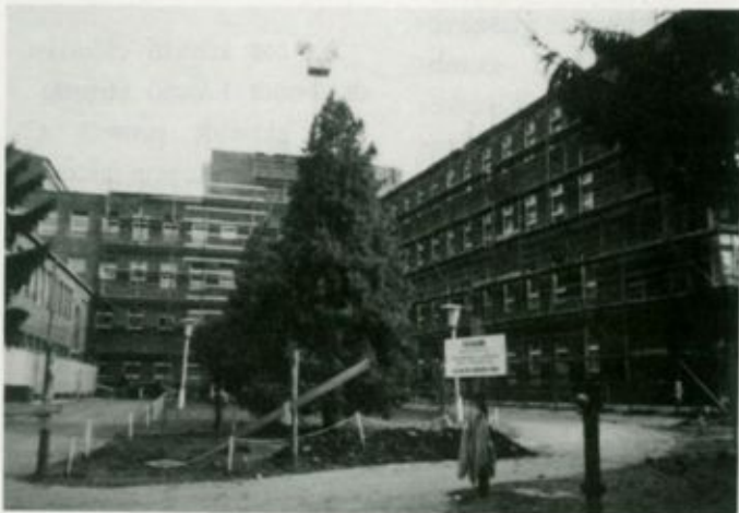
A rekonstrukció a hotelépület "B2" szárnyában

Az 1. és a 2. emelet csak fekvőbeteg-ellátásra szolgál és a személyzet számára elérhető (liften, illetve a lépcsőházon keresztül).