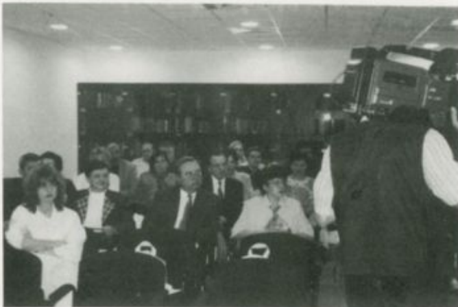
A tudományos ülés résztvevői