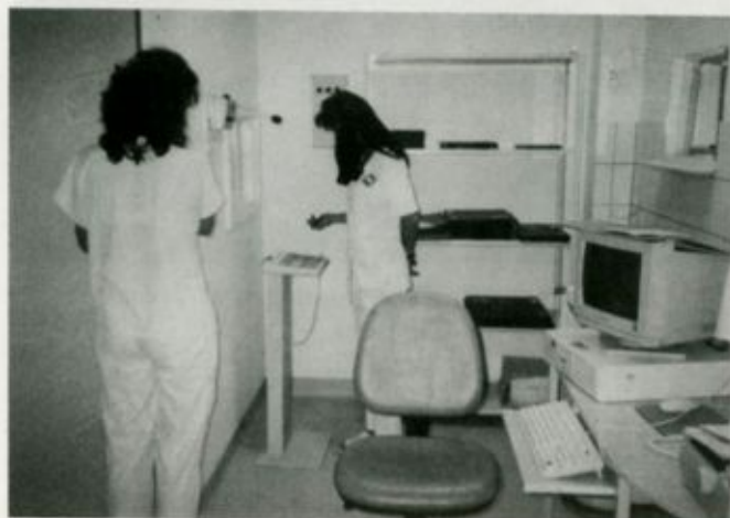
Munka közben a röntgenasszisztensek

- Ezen a területen a hasi szervek, a kismedence, a nyaki szervek ultrahang-vizs-