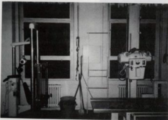
Ilyen volt a régi röntgenosztály felvételt készítő helyisége

szati szakterület szintén Hitachi gyártmányú ultrahang készülékkel rendelkezik, ami az echokardiográfia céljainak is megfelel.