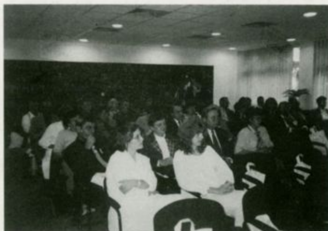
Tudományos ülés Fehérgyarmaton 6-7. oldal

Folytatódik a rekonstrukció . . . . . 5. oldal