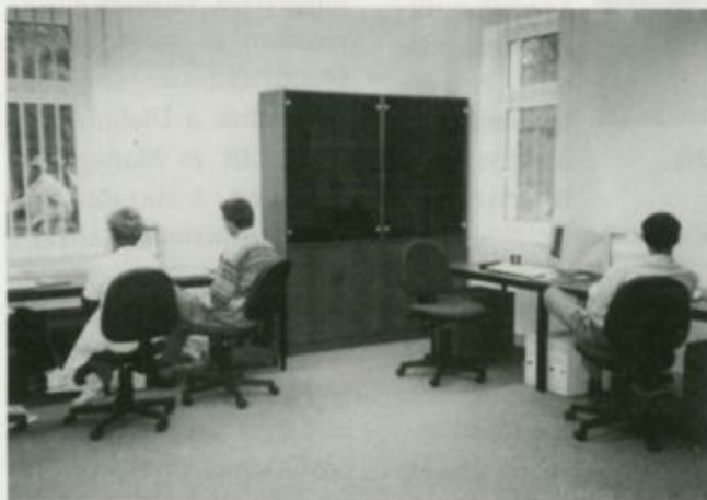
A munkakörülmények lényegesen jobbak