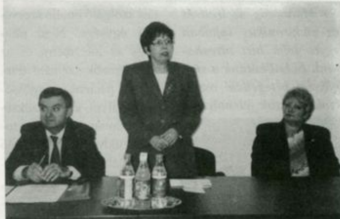
Kórházunk főigazgatója megnyitja az egészségügyi fórumot

ivel tekintette meg a Szatmár-Beregi Kórházat, és kért információkat az ellátás helyzetéről, valamint pénzbeli adományt ajánlott fel a Szatmár-Beregi Újszülöttekért Alapítványnak.