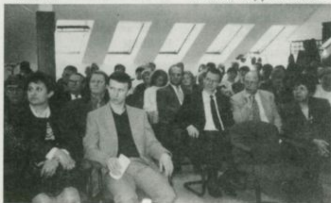
A tudományos ülés résztvevői