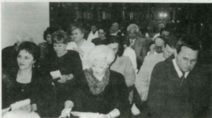
A továbbképzés résztvevőinek egy csoportja