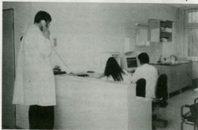
Korszerű nővérpult a sürgősségi osztályon

- Milyen a kapcsolatuk a kórházban működő más orvosi szakterületek kép-