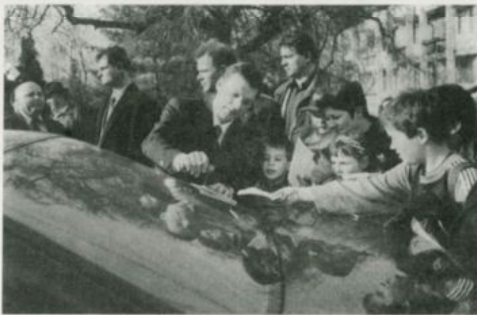
Orbán Viktor fehérgyarmati gyerekeknek ad autogramot

A következő összejövetele március 29-én került sor, amikor dr. Kökény Mihály vezetésével az Országgyűlés Egészségügyi és Szociális Bizottságának szocialista képviselő tagjai tartottak fórumot az egészségügyi ellátásokat, kiemelten pedig a kórházi ellátásokat érintő aktuális szakpolitikai kérdésekről. A nagy