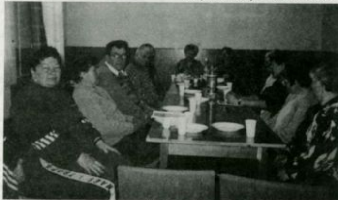
A klub tagjai

hogy kulturális, irodalmi életművekhez jussanak, a rendszeres találkozókra mindig központi helye van a zene-