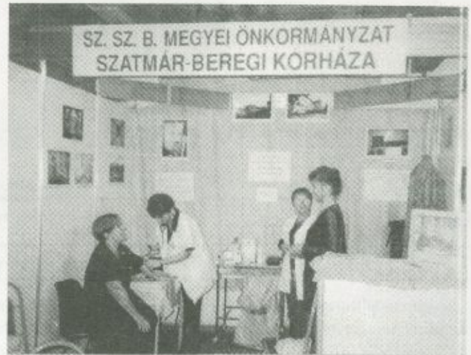
A Szatmár-Beregi Kórház standja

kiállításon, hogy igenis büszkén beszélhettek munkatársaik a szakmai újdonságokról, a rekonstrukció kapcsán Fehérgyarmaton és Vásárosnaményban tapasztalható kedvező változásokról. Intézményünk megítélésének szempontjából azért is fontos volt a részvétel a Bereg Expón, mert így sokan - az érdeklődő látogatók, valamint a politikai és a gazdasági élet meghatározó személyiségei is - megismerhették intézményünket, valós képet kaphattak a kórházban folyó munkáról.