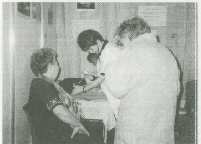
Vérnyomás mérés a kórházi standon