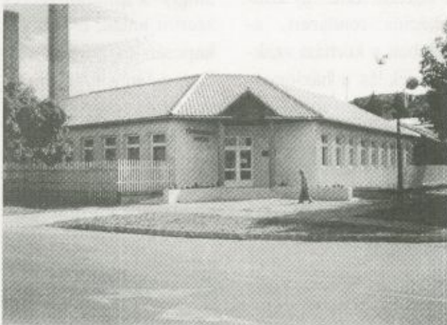
A fehérgyarmati új tüdőgondozó épülete

egyik oka volt az, hogy a városban a régi gondozó rendkívül rossz, elkeserítő állapotú épületében előregedett, gyakran meghibásodó gépekkel voltak kénytelenek dolgozni az intézet munkatársai. A másik ok talán még szomorúbb. Térségünkben sajnos rendkívül sok a tbc-s és a tüdőrákos ember, akiknek az élete múlhat azon, hogy súlyos betegségeiket mikor fedezik fel az orvosok. Aggodalomra adhat okot az is, hogy egyre elkeserítőbb hírek érkeznek a megyénkkel határos Romániából és különösen Ukrajnából. Ukrajna egyes részein immár járványos méretekben terjed a tbc, és sajnos a