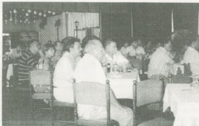
Az orvos-szakmai rendezvény résztvevői

Az előadás után lehetőség volt arra is, hogy a résztvevők feltegyék a konzultációs rendszerrel