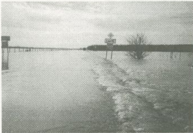
Fülesd és Mánd községek között elöntötte és járhatatlanná tette az utat, majd a szatmári térség jelentős részét is elborította a Túr kiáramló vize

műtétek elhalasztása miatt, másrészt többletterhek jelentkeztek az árvizes területekről befogadott betegek ellátása, a hosszabb közlekedési útvonal, a megnövekedett anyagszükséglet és a fokozott készenléti szolgálat miatt. Ezt a nehéz helyzetet a kórház kezelni tudta, ám a kiesések és a nem tervezett kiadások mégis komoly plusz terhet jelentettek a normális körülmények között is szűkös gaz-