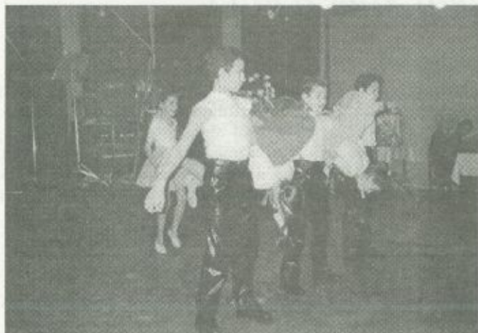
Részlet a fehérgyarmati akrobatikus rock and roll táncgyűttes műsorából