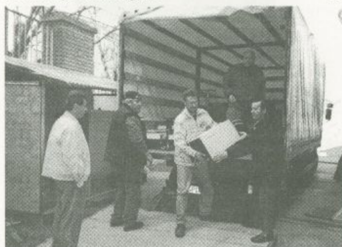
A kórház munkatársai átveszik a második szállítmányban érkezett orvosi műszereket, eszközöket, berendezéseket