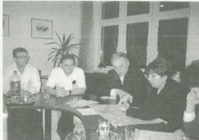
A kialakult helyzetről, a további várható teendőkről a kórház főigazgatója tájékoztatta az egészségügyi minisztert