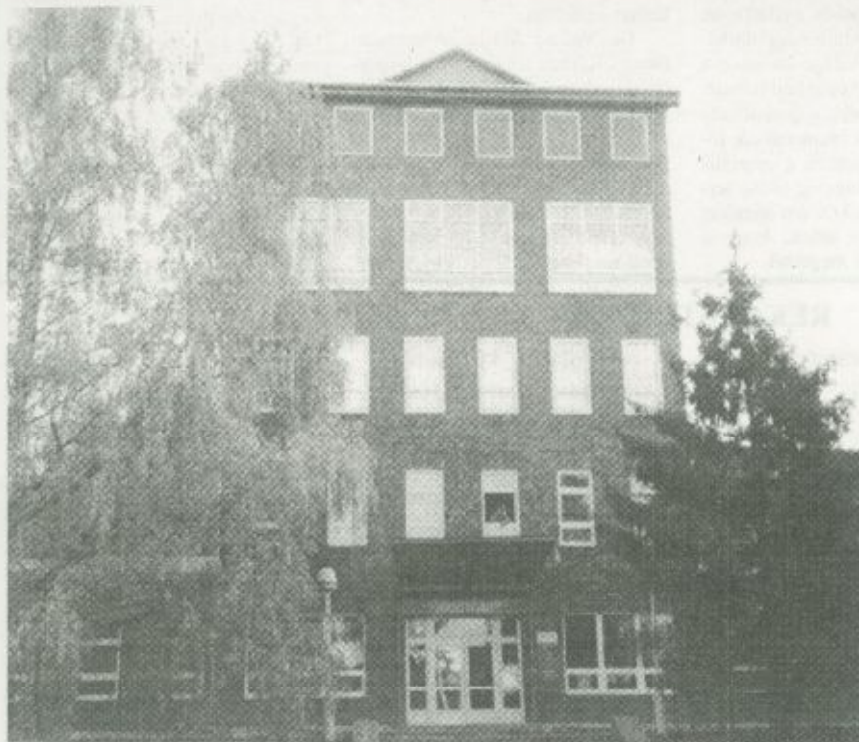
A Szatmár-Beregi Kórház, fehérgyarmati épületegyüttesének megújult főhomlokzata.

A fehérgyarmati kórházi épületekben befejeződő rekonstrukciós munkálatokról szóló képes beszámolóink a 2. oldalon található.