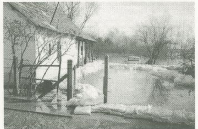
A lakosok próbálták megmenteni házaikat, értékeiket, ám ez sok helyen sajnós a megfeszített munka ellenére sem sikerülhetett

Gondot jelentett, hogy a Fehérgyarmat és Vásárosnamény közötti útszakasz nagy része víz alá került, így ezen az útvonalon lehetetlenné vált a két kórházi telephely közötti közlekedés. Szerencsére Mátészalkán keresztül - még ha hosszabb útvonalon is - fennakadások nélkül meg lehetett oldani, hogy a szakemberek eljussanak Vásárosnaményba, vagy onnan Fehérgyarmatra. A közlekedési útvonal megváltozása miatt nehézített volt ugyan, de zökkenőmentesen megoldott volt a betegellátáshoz nélkülözhetetlen gyógyszerek, eszközök, más szakmai anyagok és a