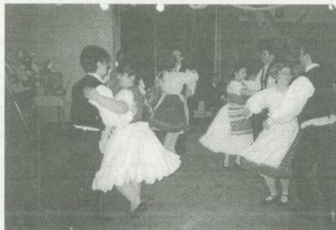
A Szatmár Néptáncgyűttes műsorának egy pillanata

hivatalosan is igazolja, hogy az ország és a megye legkeletibb szegletében is a nemzetközi normákhoz igazítottan történik a betegek gyógyítása. A főjegyző hozzáfűzte: a tulajdonos megyei önkormányzat a továbbiakban is minden segítséget meg fog adni ahhoz, hogy a betegellátással kapcsolatos elvárásoknak hosszú távon is meg tudjon felelni a kórház, a gyógyítás feltételei továbbra is biztosítottak legyenek. Ennek a segítségnek, támogatásnak egyik konkrét bizonyítéka az is, hogy a Megyei Közgyűlés február 19-én, amikor a 2001-2002-es költségvetést jóváhagyta, a fehérgyarmati rekonstrukció folytatásához feltétlenül