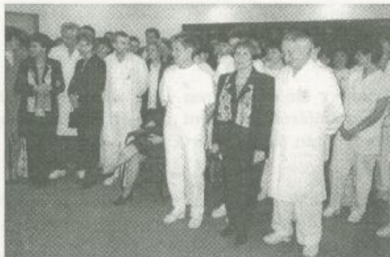
Az ünnepség résztvevői