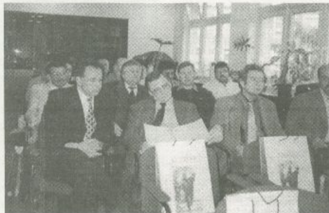
Az orvostovábbképző rendezvény résztvevői

A továbbképzés végén a rendezvényt támogató Richter Gedeon Rt. apró ajándékait és a cég által gyártott készítmények ismertető füzetit vehették át a résztvevők.