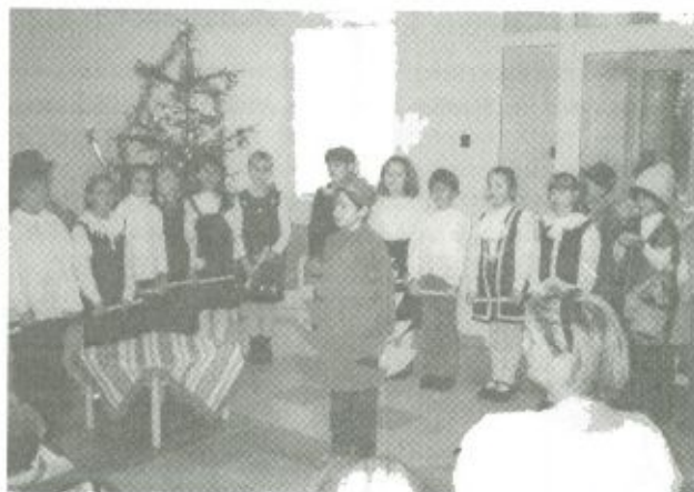
A Bárdos Lajos Általános Iskola tanulói által adott műsor egy pillanata

A Szatmár-Beregi Kórházzal kiemelkedően jó kapcsolatot ápoló fehérgyarmati önségítő