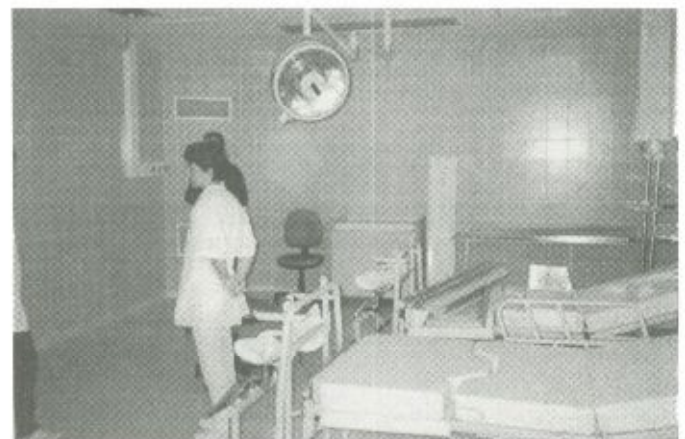
Az új szülőszoba megtekintésére is lehetőség volt a bejárás során