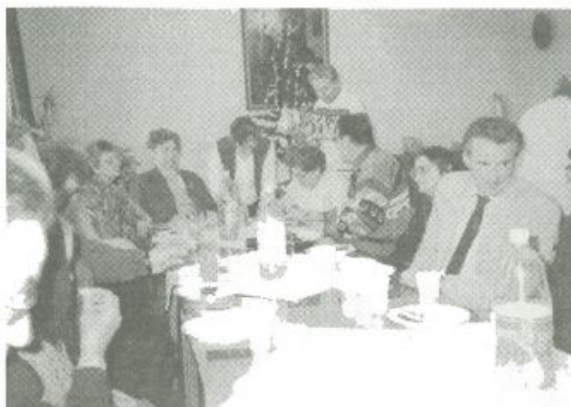
Karácsony a Sorstársak Klubban