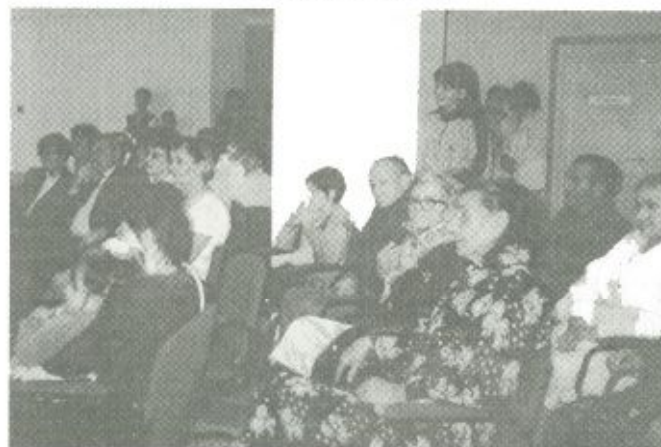
A fehérgyarmati ünnepség résztvevői

klubok is megtartották karácsonyi ünnepségeiket. A Nyugdíjasklub december 18-án, a Vakok és Gyengénlátók Sorstársak Klubja december 20-án, míg a daganatos betegek Reménység Klubja december 22-én várta tagjait családias hangulatú karácsonyi ünnepségre.