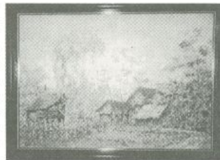
Falun - Rozsály