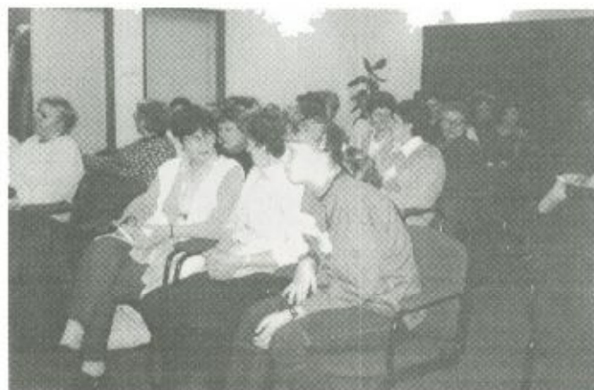
A Menopausa Klub tagjai

Ha dohányzik, haladéktalanul hagyja abba a dohányzást!