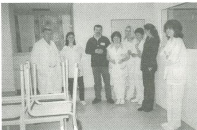
A kórház dolgozói a gyermekosztályon