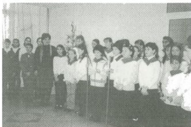
Az Eötvös József Általános Iskola tanulói

beszédet, amelyben kiemelte: ez a karácsony több okból is különleges. Egyrészt az évezred utolsó karácsonya, és intézményünk szempontjából különleges azért is, mert a családi hangulatú összejövetelt a megújult kórházi épületben egy nagyon kemény, sok munkával járó, ám a ne-