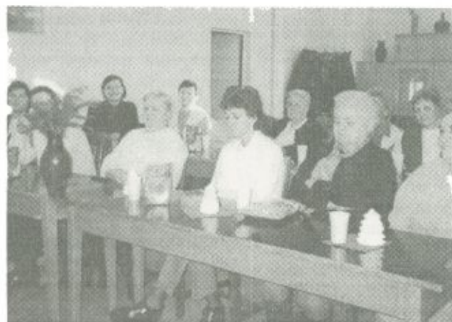
A Reménység Klub összejövetelének egy pillanata