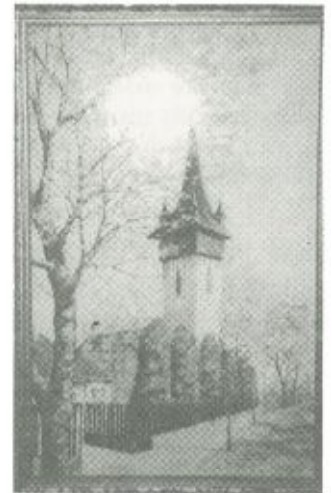
Fehérgyarmat, a református templom - ős