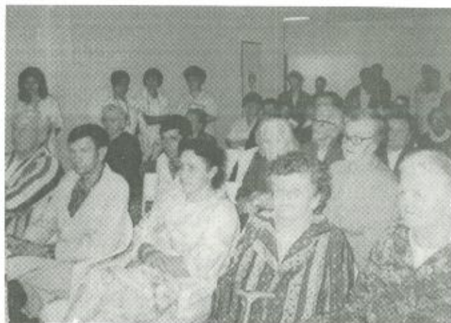
A Vásárosnaményban gyógyuló betegek meghatódva fogadták a műsort