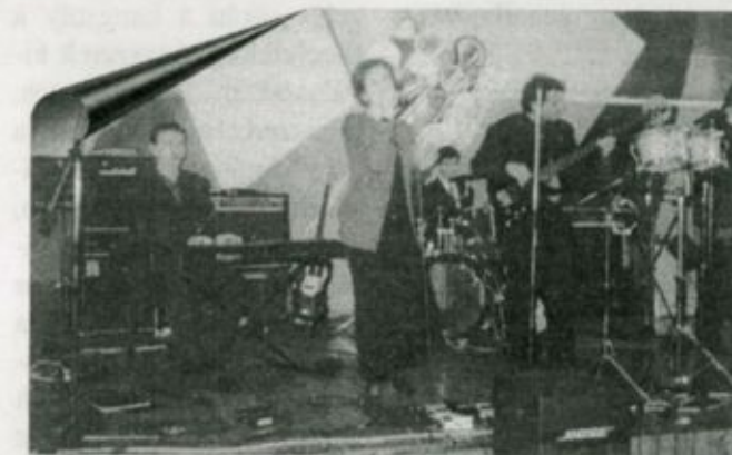
A JazzColor együttes műsorának egy pillanata