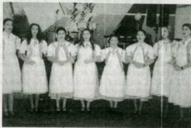
Az Eötvös József Általános Iskola volt tanulói népdalokat adtak elő

naményi Eötvös József Általános Iskola 3. osztályos tanulói adták elő Karnevál című csoportos táncukat, majd a Petőfi Sándor Általános Művelődési Központ diákjainak rock and roll táncja következett. Ezek után énekes-zenes produkciók szórakoztatták a báli közönséget: az Eötvös iskola volt diákjai népdalokat énekeltek, a budapesti JazzColor együttes pedig népszerű jazz-számokat adott elő.