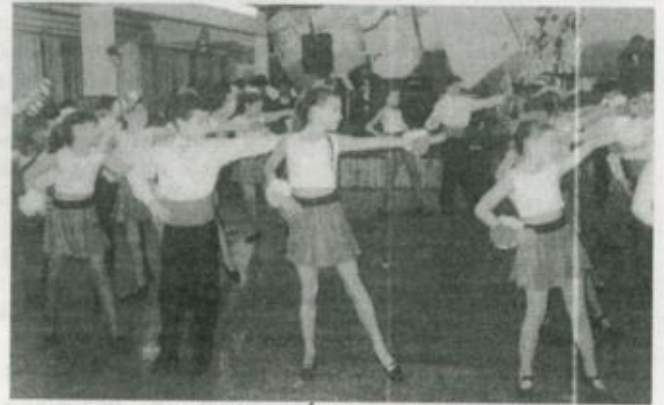
Az Eötvös József Általános Iskola diákjai