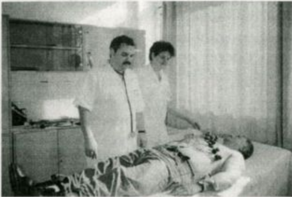
Vizsgálat a belgyógyászati szakrendelőben

- Milyen betegségekkel kerülnek a leggyakrabban az osztályra,