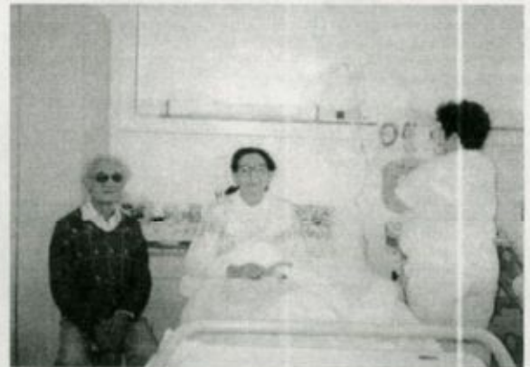
A betegek gyógyítására modern, a rekonstrukció során teljesen megújult betegszobákban van lehetőség

nagy többsége az idősebb korosztályokból kerül ki, pácienseinknek tavaly csupán 6,52%-a tartozott a 41 és 50 év közötti korcsoportba, 51-60 év közötti volt a betegek 10,87%-a. A 61-70 év közötti betegek aránya mindössze 17,39%, ami talán meglepő, hiszen ez a korcsoport a köztudatban úgy szerepel, hogy abban kiemelkedően sok a beteg ember. Nálunk a 71 éven felüliek aránya nagyon