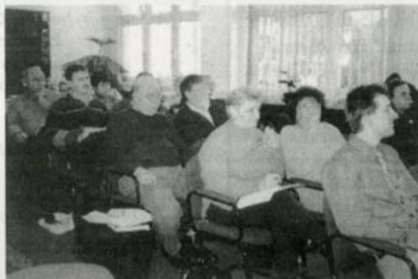
A továbbképzés résztvevői