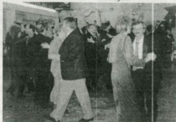
A báli mulatság egy pillanata