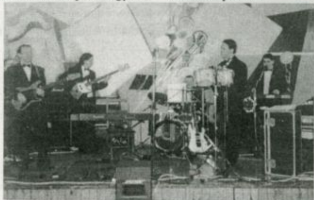
A tánchoz a Dimenzió zenekar szolgáltatta a zenét

A bál szervező csapata és a kórház vezetése ezúton is köszönetet mond mindazoknak, akik a rendezvény sikeréhez hozzájárultak. Külön köszönet illeti a szakiskola diákjait, akik munkájukkal, valamint a támogatókat, akik nagyvonalú felajánlásaikkal járultak hozzá ahhoz, hogy az évezrednyitó vásárosnaményi bál felejthetetlen élményeket nyújtson, szép emlék maradjon.