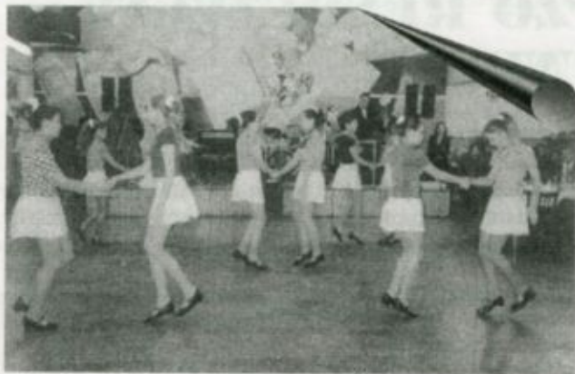
Rock and roll: a Petőfi Sándor Általános Művelődési Központ tanulói