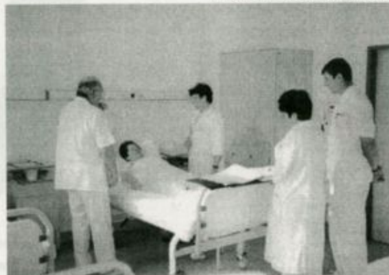
Főorvosi vizit a vásárosnaményi belgyógyászati osztály egyik betegszobájában

- Osztályunkon négy szakorvos dolgozik, illetve ötödikként egy orvosgyakornok kolléga segíti a munkát. A belgyógyász szakképesítés mellett többen rendelke-