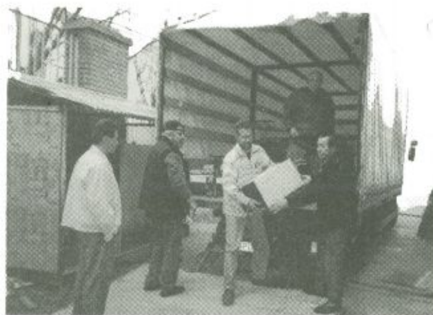
A kórház munkatársai átveszik a második szállítmányban érkezett orvosi műszereket, eszközöket, berendezéseket

Örömmel közölhetjük, hogy az ígért segítséget megkapta a Szatmár-Beregi Kórház, az egészségügyi minisztérium koordinálásában fontos, a biztonságos ellátást garantáló, jól használható anyagok és eszközök érkeztek két részletben az intézménybe az Egészségügyi