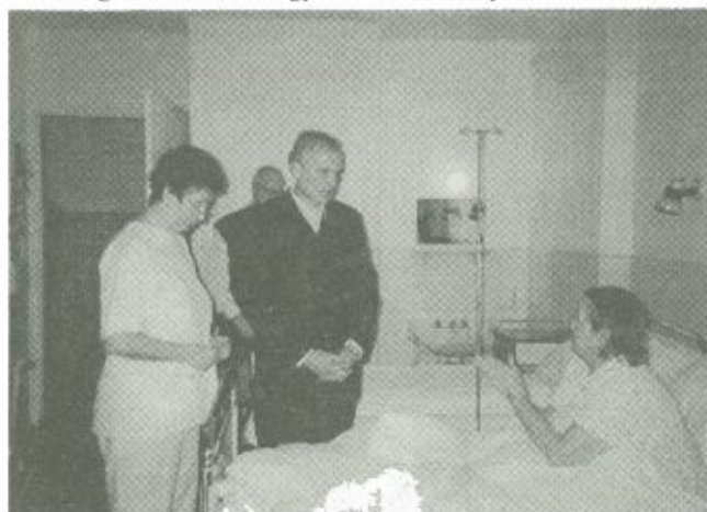
Dr. Mikola István, egészségügyi miniszter az árvíz sújtotta beregi településekről érkezett, kórházunkban elhelyezett betegeket látogatott meg a fül-orr-gége osztályon

Az egészségügyi miniszter elmondta, hogy nem fog megelégedezni a kórházzal, igyekszik minden segítséget megadni intézményünknek. Az árvízi helyzettel kapcsolatban közölte, hogy nagy mennyiségű gyógyszert és oltóanyagot hoztak a térségbe, amelyre azonban egyelőre nem volt szükség, mivel az ellátást magas színvonalon biztosítani tudták az intézmények. Hozzáfűzte azt