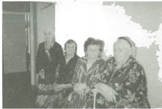
Vámosatyai betegek a fehérgyarmati szükségosztályon

mélyi feltételek biztosítása két okból volt rendkívül nehéz: egyrészt, mert dolgozóinknak mintegy kétharmadát érintette valamilyen formában az árvíz: