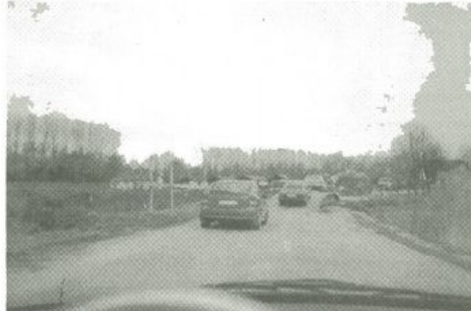
Hetekkel az árvíz után is pontonhídon közelíthető meg Gergelyugornya Jánd felől