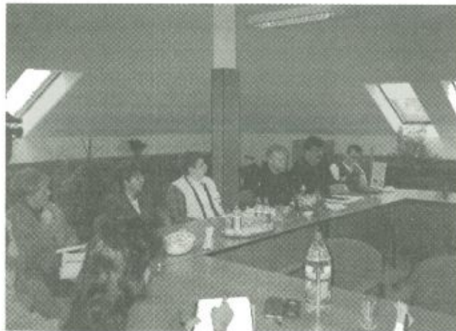
Az egyeztető megbeszélés résztvevői

A karitatív szervezetek részt vesznek a károsultakat érintő szociális és mentális segítségnyújtásban. Ebben a munkában