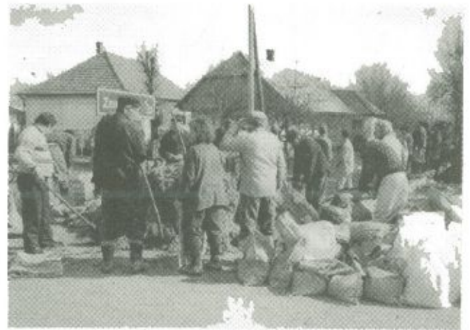
Árvízi védekezés Fülesden