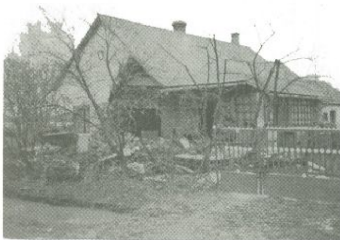
Félig összedőlt, pusztulásra ítélt lakóház Gulácson