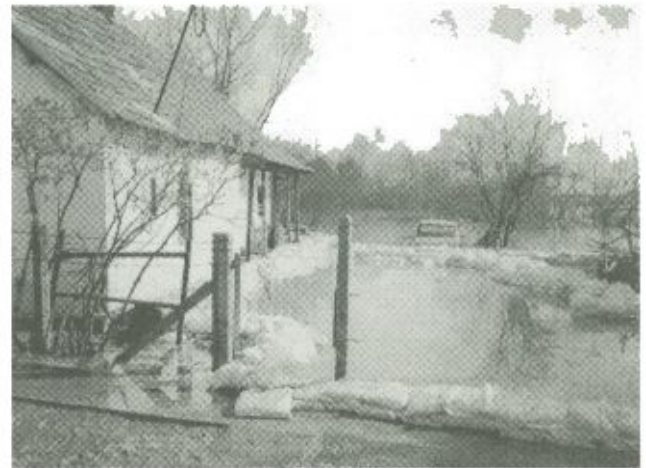
A lakosok próbálták megmenteni házaikat, értékeiket, ám ez sok helyen sajnó a megfeszített munka ellenére sem sikerülhetett

Sokáig gondot jelentett, hogy a Fehérgyarmat és Vásárosnamény közötti útszakasz nagy része víz alá került, így ezen az útvonalon lehetetlenné vált a két kórházi telephely közötti közlekedés. Szerencsére Mátészalkán ke-