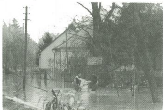
Az emberek a legnehezebb körülmények között is próbálták menteni értékeiket