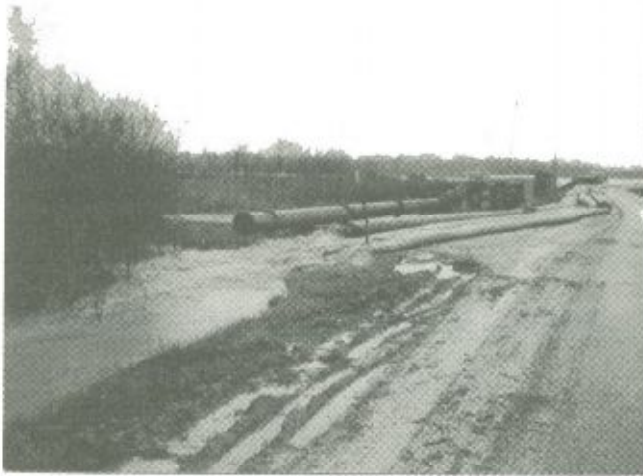
A szakemberek mobil szivattyútelepekkel mentesítették a katasztrófa sújtotta településeket a soha nem látott mennyiségű víztől. Képzünk Jánd határában készült.