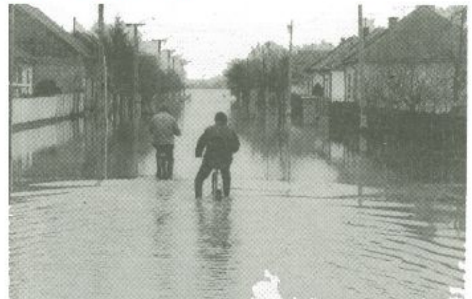
Helyi lakosok egy elöntött utcában. Hasonló viszonyok uralkodtak szinte minden beregi településen