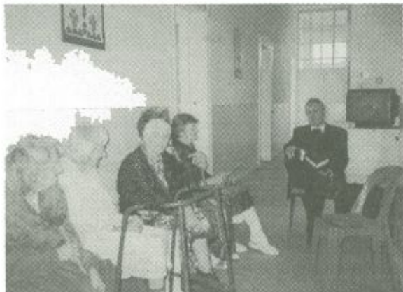
Az istentisztelet egy pillanata

van a támogatásra; az anyagi és tárgyi segítségnyújtás mel-