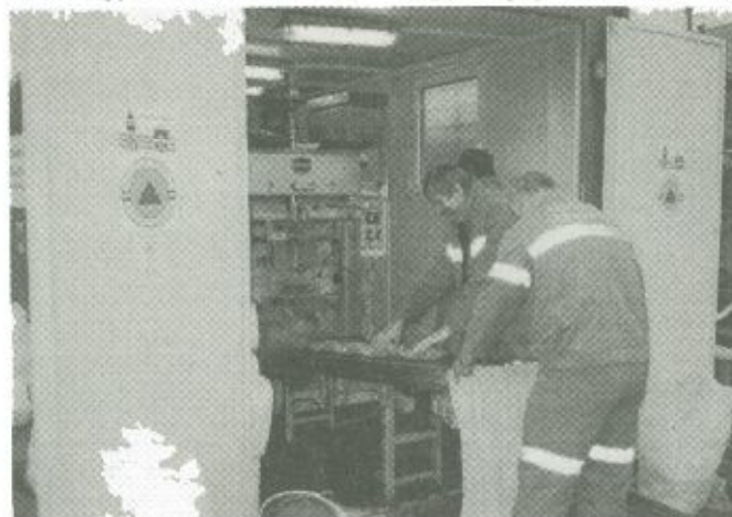
A berendezés csomagoló része. Az ivóvíz egy literes zacskókban került az árvizes területekre.