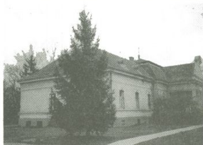
A fehérgyarmati szükségosztályt előbb a sürgősségi osztály régi helyén, majd a képiúkon látható, korábban a nővérszállónak is helyt adó kastélyépületben üzemeltette a kórház