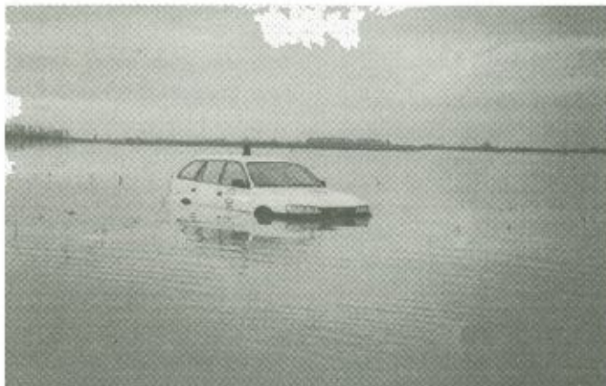
Szerencsétlenül járt autó Tarpa határában