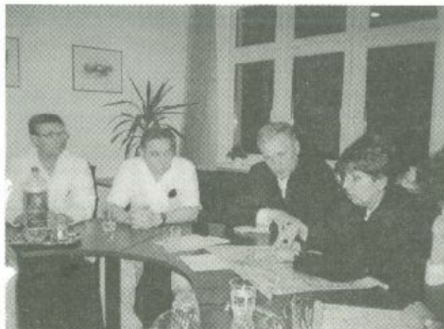
A kialakult helyzetről, a további várható teendőkről a kórház főigazgatója tájékoztatta az egészségügyi minisztert

A miniszteri vizit alkalmat adott arra is, hogy egy rövid megbeszélés keretében a kó-