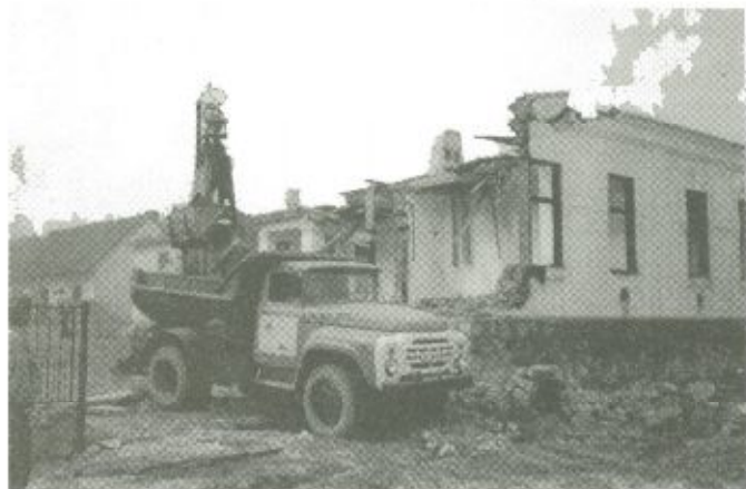
Használhatatlanná vált, életveszélyes épület bontása Tákoson