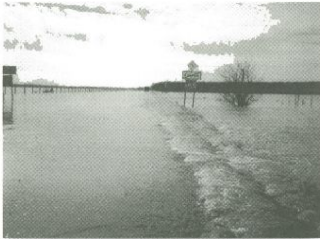
Fülesd és Mánd községek között elöntötte és járhatatlanná tette az utat, majd a szatmári térség jelentős részét is elborította a Túr kiáramló vize

El kell azonban mondani, hogy a különleges helyzet egyrészt bevételkiesést okozott a tervezhető időpontú műtétek, kivizsgálások, gyógykezelések elhalasztása miatt, másrészt többletterhek jelentkeztek az árvizes területekről befogadott betegek ellátása, a hosszabb közlekedési útvonal, a megnövekedett anyagszükséglet és a fokozott készenléti szolgálat