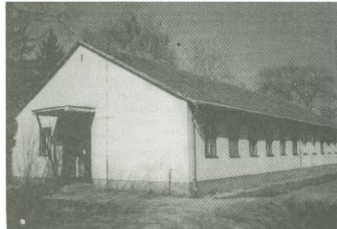
Vásárosnaményban a felvételiúton látható régi fül-orr-gége osztály épülete fogadta a legtöbb beteget. Jelenleg a még kórházban ápolott betegek a beregi telephelyen a belgyógyászati-, a krónikus-rehabilitációs és az ápolási osztályon, valamint a sebészeti részlegen kapnak ellátást.