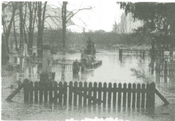
A víz a temetőket is elárasztotta