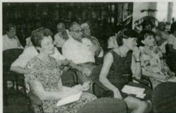
A tudományos ülés résztvevői

(A DNS laboratórium további jellemzőiről, szerepéről, az elvégezhető vizsgálatokról terveink szerint következő lapszámainkban is közlünk ismertető írásokat.)