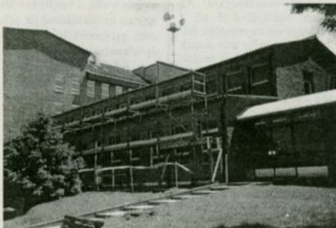
Képünk előterében látható a felújítás alatt álló szakrendelői épületszárny