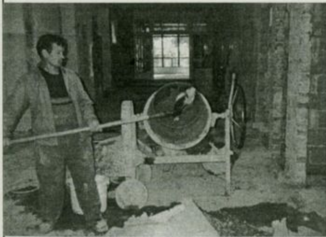
A kivitelező cég dolgozói folyamatosan készítik a falazáshoz és vakoláshoz szükséges kötőanyagokat

Lapzártánk idején zajlott az emeleti szakrendelők padlóburkolatának eltávolítása, valamint az új lift helyének, illetve a liftaknának a kialakítása. Folyamatosan zajlott a keletkező törmelék elszállítása és a falak vakolása. Elkészült a külső állványzat, így elkezdődhet a külső felületek, épületrészek felújítása is.