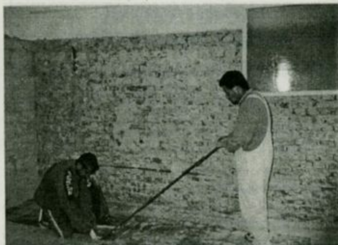
A padlóburkolat eltávolítása a szemészeti szakrendelő helyiségében