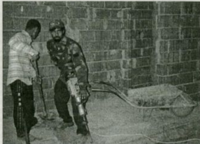
A vízvezeték- és csatornarendszer cseréjéhez fel kellett törni az épület belső betonozott felületeinek nagy részét