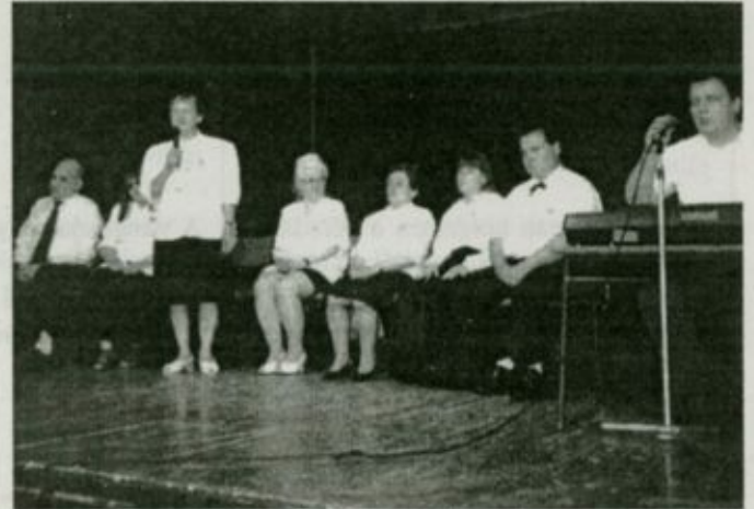
Az előadás egy pillanata

és anyagi segítségükkel hozzájárultak a rendezvény sikeres lebonyolításához. A fellépő vendégek ezután a támogatók által felajánlott aján-