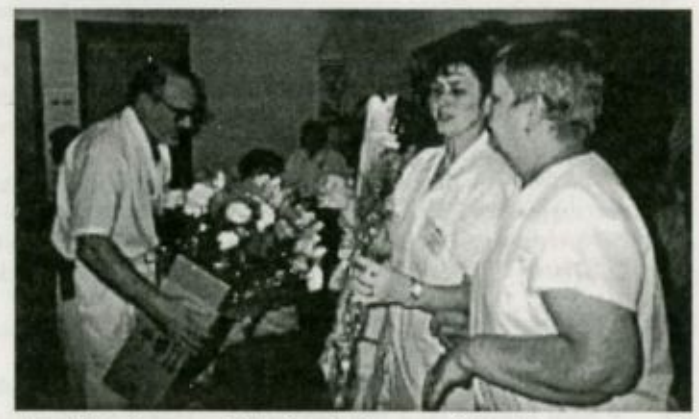
Az nőnapra megemlékezés végén a megjelentek egy-egy szál virágot vehettek át