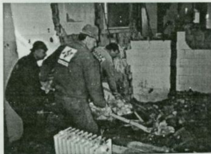
Munka közben a Kelet/Építő Kft. dolgozói. Képünk a régi válaszfalak elbontása során keletkező törmelék eltávolításakor készült.