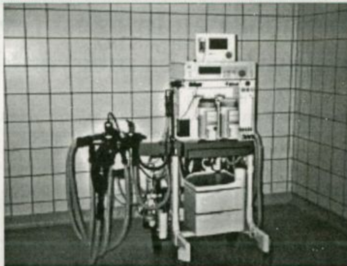
Az egyik új altatógép

tavalyi év folyamán egy súlyosan mérgezett beteget sikerült ezzel a módszerrel meggyógyítani, idén pedig ugyancsak ezt az eljárást kellett egy betegnél egy alkalommal, egy másik, politraumatizált betegnél pedig egymás után többször alkalmazni. Ez utóbbi betegnek akut veseelégtelensége volt, és életét csak a dialízisnek a többszöri elvégzése menthette meg. A beteg azóta felépült. Ezt a beavato-