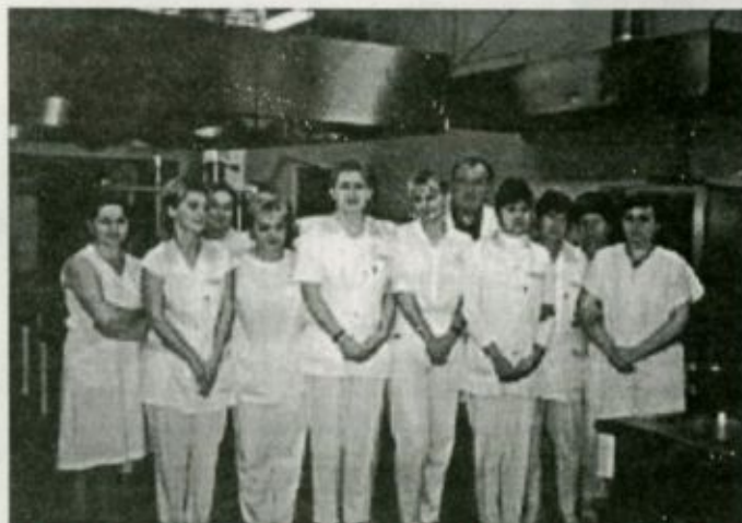
A fehérgyarmati konyha dolgozóinak egy csoportja

A konyha minimum 400 adag előállítására tervezett, maximális kihasználás esetén 500 ember napi kiszolgálását teszi lehetővé. Jelenleg átlagosan napi 350 főre főzünk. A betegek étkeztetése során a betegösszetételtől függően