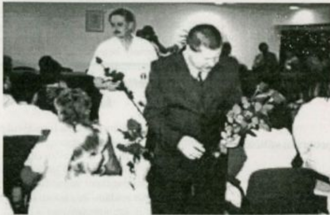
A Menopausa Klub tagjainak köszöntése a nőnap alkalmából