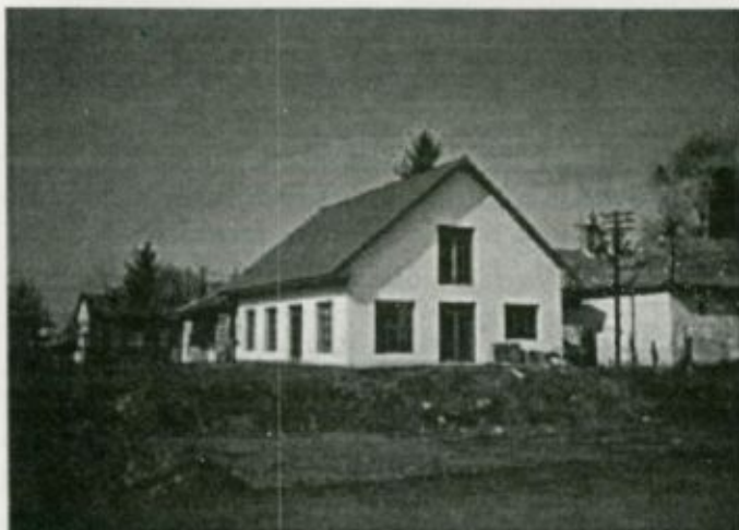
Az új klubház a tenispályák szomszédságában