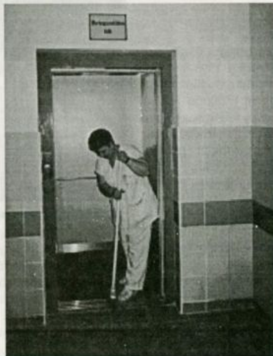
Felvételünkön az új lift takarításának egy mozzanata látható

Az új, modern, energiatakarékos és könnyen kezelhető személyfelvonó a lépcső közelében található, és természetesen bárki által igénybe vehető, használható.