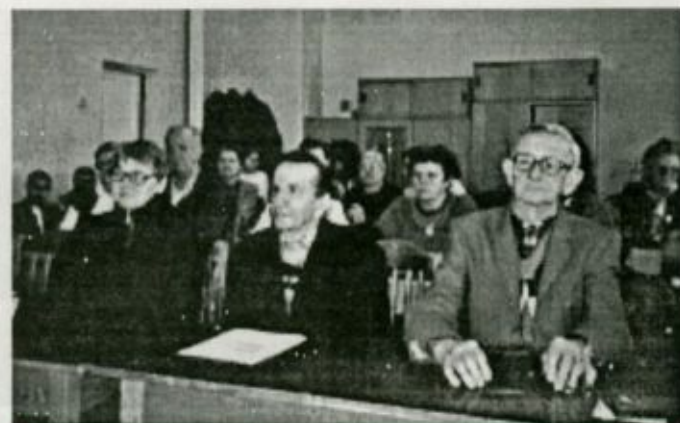
A klubtagok egy csoportja

A szövetség nagyon fontos a hallássérültek számára, hiszen ha nem létezne, a siketek és nagyothallók mástól nem, vagy csak nagyon ritkán kapnának segítséget gondjaik megoldásához. Azért is volt fontos a fehérgyarmati klub létrehozása, mert a helyi problémákat helyben lehet a legnagyobb sikerrel kezelni, megoldani. Bizonyított tény, hogy az önkormányzatoknál és más hivatalos szerveknél szerve-