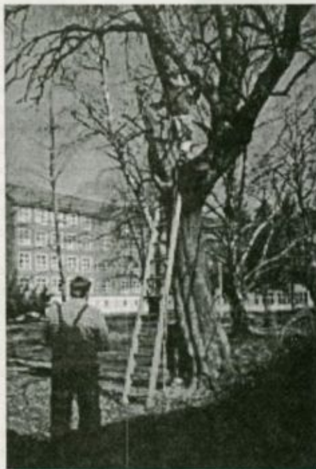
Az új tenispályák helyének szabadá tétele érdekében több, főként öreg és beteg fát kellett kivágni