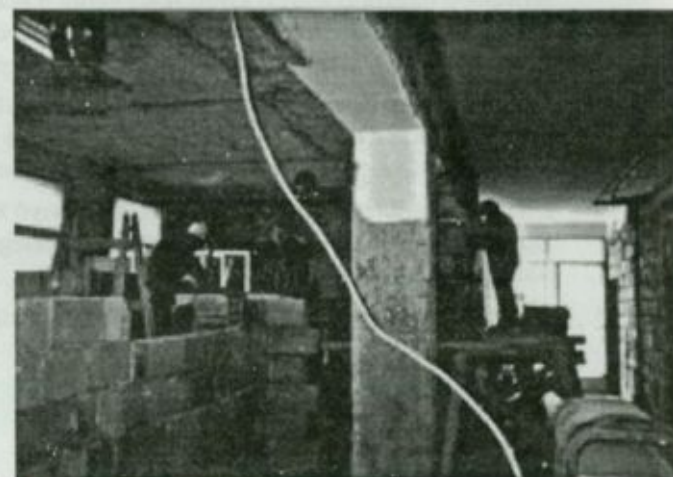
Az új válaszfalak készítésének egy pillanata