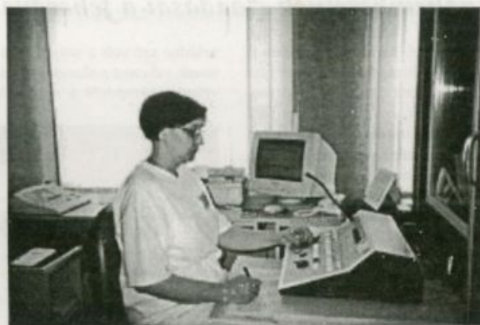
Szabó Ádám munkáiban az audiológiai szakrendelőben

tartóval felszerelt vizsgáló szék is került, amelyet több pozícióba lehet állítani. Automatikusan állítani lehet a magasságát, hátra lehet dönteni akár annyira,