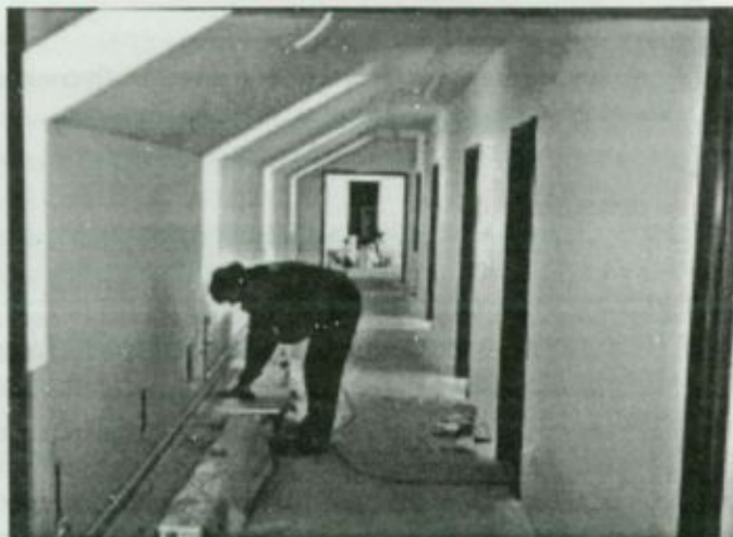
A munkálatok befejező szakaszukhoz értek a tetőtérben