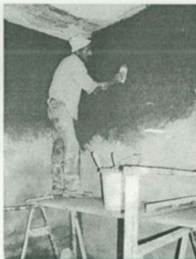
Kőműves munka a mellkas-átvilágító berendezés későbbi elhelyezésére szolgáló helyiségben