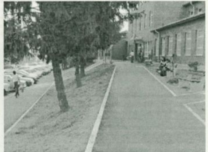
Kórházunk főbejáratának megújult környezete

A Szatmár-Beregi Kórház vezetése köszönetet mond Fehérgyarmat város polgármesterének és képviselőtestületének a kórház előtti járda és feljárók soron kívüli felújításáért.