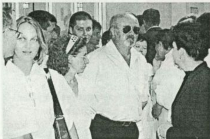
A megemlékezés résztvevőinek egy csoportja