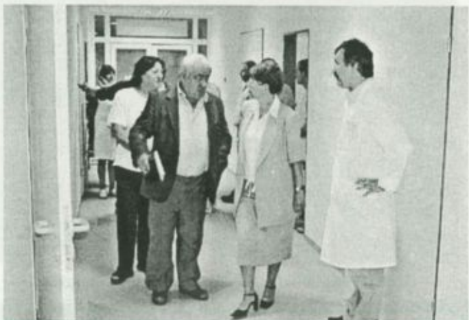
Felvételünk a szakhatósági bejárásán készült

Az alagsorban a raktárak és öltözők találhatóak meg, és itt került kialakításra az intézmény egyetlen dohányzásra kijelölt helyisége is.