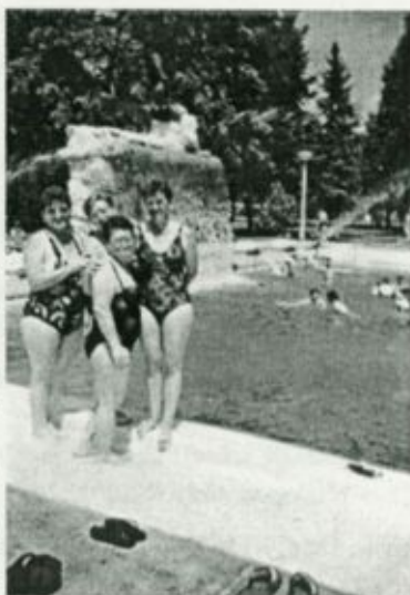
Menopausa Klub tagjai a berekfürdői strandon

több gyógymedence, mesterséges vízesés biztosítja a sportolási, fürdőzési, kikapcsolódási lehetőségeket. A klub tagjai számára a kirándulás ingyenes volt, a költségeket a klubnak nyújtott önkormányzati támogatásból fedezték a szervezők.