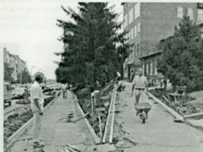
A kórház előtti járdák felújításának egy pillanata