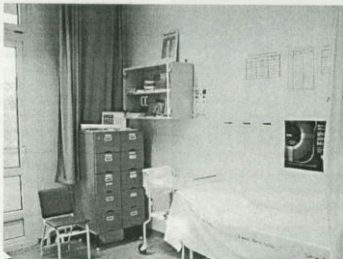
A vásárosnaményi diabetológiai szakrendelő egy részlete