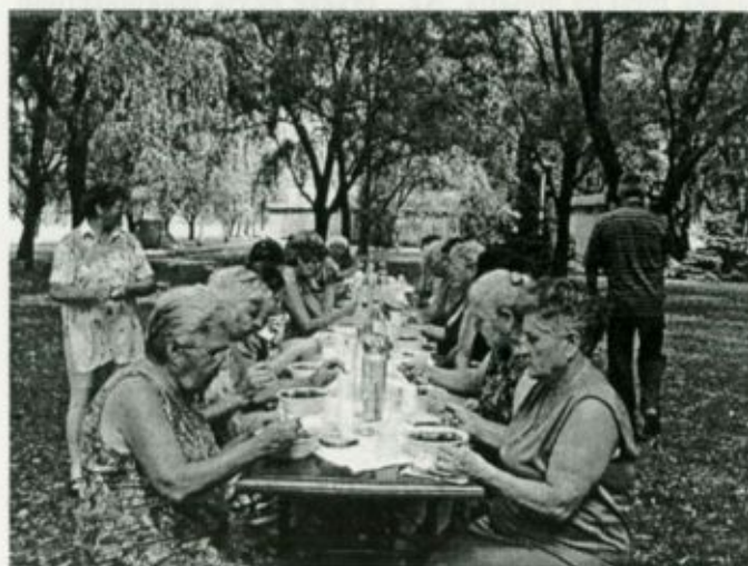
A Menopausa Klub tagjai a Gulyás-Party rendezvényen

Augusztus 8-án került sor a Menopausa Klub immár hagyományos Gulyás-Party rendezvényére, a fehérgyarmati Városi Strandon. A kezdetben szép, nyári időben a klub vezetői és