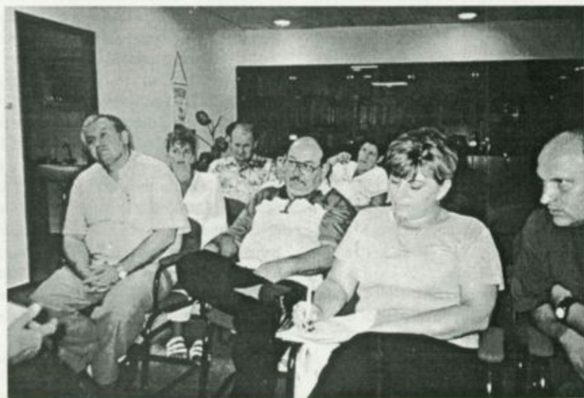
A szakszervezeti gyűlés résztvevői

Szó volt a további konkrét teendőkről, szakszervezeti követelésekről, így például arról a huszonhat pontból álló petícióról, amelyet még az előző kor-