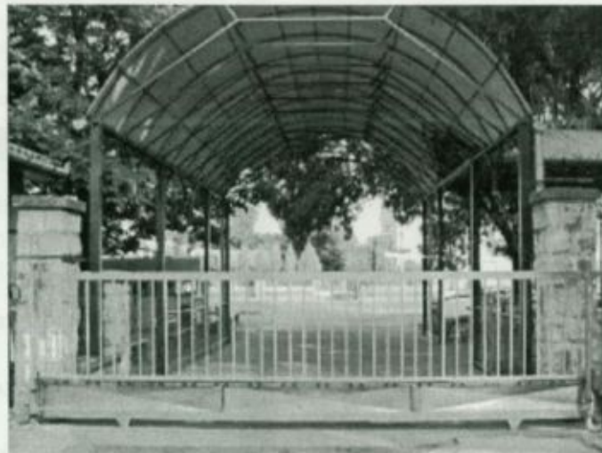
Az új tolókapu a mentőportánál

A járda, illetve a feljárók átalakítása mellett kórházi ráfordítással megtörtént a főbejárat előtti lépcső ideiglenes felújítása is, így most már sokkal szebb képet mutat a kórház külső környezete, mint akár néhány héttel ezelőtt.