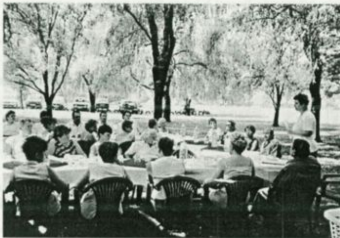
A minőségügyi nap résztvevői a fehérgyarmati strandon

A minőségügyi nap második napirendi pontjaként került sor a június 5-én megtartott belső auditori továbbképzésen való sikeres részvételt igazoló oklevelek