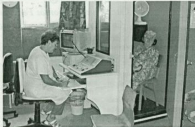
Vizsgálat előtti pillanat a vásárosnaményi audiológiai állomás egyik helyiségében