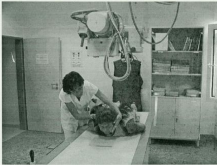
Orr-melléküreg felvétel előkészülete a radiológiai osztályon

A radiológiai osztályon dolgozók munkáját nagy mértékben megkönnyíti és a diagnózis felállítását gyorsabbá teszi a mindkét telephelyen rendelkezésre álló filmelőhívó automata.