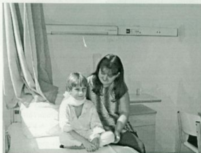
Beteg gyermek édesanyjával a gyermekosztály vásárosnaményi részlegén

A rekonstrukció igazán nagy, minőségi változást eredményezett az ellátás körülményeiben Vásárosnaményban és Fehérgyarmaton egyaránt.