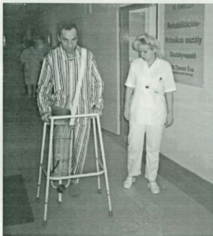
Az amputált betegek rehabilitációjának egyik fázisa: pneumatikus léglábbal történő járástanítás

Az osztály mellett rehabilitációs szakrendelés is működik. Itt történik a járó betegek vizsgálata, osztályos előjegyzésük, a szükséges gyógyászati segédeszközök felírása, és az osztályról korábban távozott betegek kontrollvizsgálata.