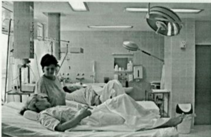
Szülés előtt lévő nők a modern szülőszobában

Tervezzük a nőgyógyászati rákszűrés kiterjesztését és minél otthonosabb környezetet biztosítani a betegek jobb gyógyulása érdekében."