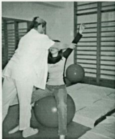
Gyógytorna a vásárosnaményi fizioterápián

A Szatmár-Beregi Kórház fizioterápiás részlegei hosszú ideig nagyon rossz körülmények között fogadták a pácienseket. Ez a helyzet azonban szerencsére már a múlté, jelenleg a kórház mindkét telephelyén tágas, jól felszerelt helyiségekben, modern gépek segítségével végzik el a kezeléseket a szakemberek. A kezelések során rendszerint több terápiás eljárás alkalmazására kerül sor. Leggyakrabban elektroterápiás és ultrahang kezelések történnek, de gyakran van szükség vizes kezelésekre, azaz négyrekeszes galvánkezelésre és a legújabb készülék, a tangentor alkalmazására. A betegek állapotának javítása során nagy szerepe van a gyógymasszázs és a gyógytornának is, melyet gyógytornászok segítségével egyéni és csoportos tornára alkalmas, jól felszerelt tornaszobákban végezhetnek a betegek.