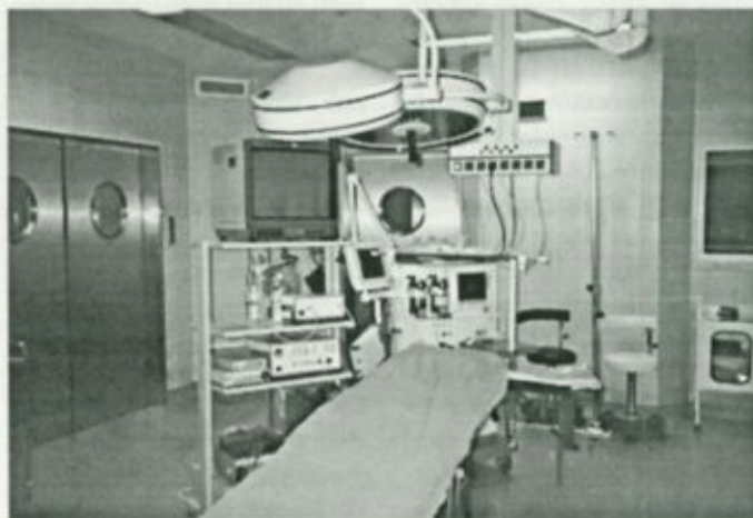
Modern műtő a fehérgyarmati új diagnosztikai és műtőblokkban

rülmények javulása eredményezett. Az új központi műtőblokk Fehérgyarmaton, valamint a felújított műtőegység Vásárosnaményban európai háttérrel ad az operációk elvégzéséhez. A műtők megfelelő nagyságúak, illetve új és kiváló műtőasztalok, műtőlámpák és kézi műszerek állnak rendelkezésre. A műtők mellett nagyon jól felszerelt ébredőszobák vannak, valamint az intenzív osztály is szervesen illeszkedik a műtőblokkhoz. Az operált betegek – ha nem szükséges az intenzív osztályon való elhelyezésük – Fehérgyarmaton a sebészeti osztály hotel-szárnyában, Vásárosnaményban a sebészeti részlegen kapják meg a műtétet követő további ellátást.