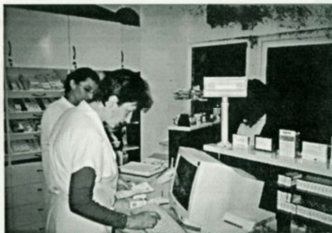
Beteg kiszolgálása a gyógyszer-tár vényforgalmi részlegében

részlegben kiválthatók a kórház dolgozói részére az országban bárhol, bár mely orvos által felírt gyógyszerek, a kórházban ellátott betegeknek felírt gyógyszerek, továbbá az intézet orvosai által felírt összes gyógyszer-készítmény. Mindezen túl az intézettel szerződéses jogviszonyban álló orvosok által felírt receptekre is kiadható gyógyszer. A vény nélkül kapható gyógyszereket, illetve gyógyhatású készítményeket természetesen bárki megvásárolhatja a kórház gyógyszer-tárában.