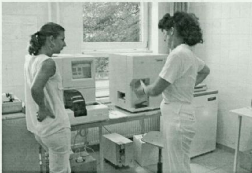
A fehérgyarmati laboratórium szakember ei munka közben a haematológiai automata és a reticulocytá analízátor mellett

A Szatmár-Beregi Kórház fehérgyarmati és vásárosnaményi laboratóriuma a rekonstrukciónak köszönhetően teljesen megújult, így a korábbiaknál lényegesen jobb munkakörülmények között, kiválóan minősített gépekkel dolgozhatnak a szakemberek. A különböző vizsgálatokat ma már külön helyiségekben lehet elvégezni. Napjainkban minden fontos munkafolyamat automatizálva van a laboratóriumban. Fehér-