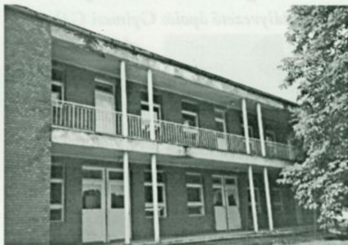
A fertőző osztály épülete

fertőző osztályon dolgozó fertőző betegség ellátására szakemberek valamennyi felkészültek.