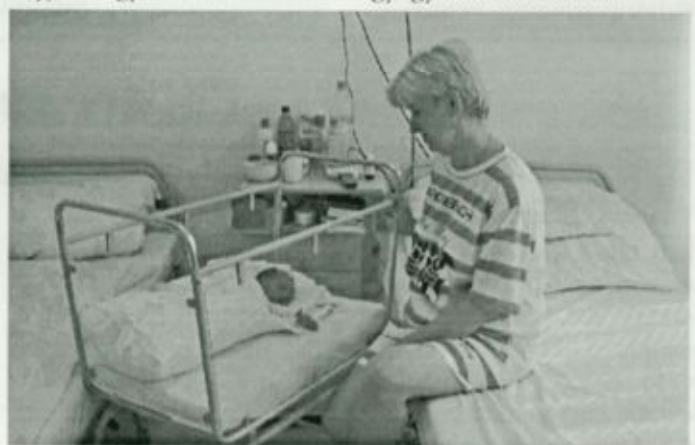
Újszülött gyermek és édesanyja a szülészeti osztály bababarát kórtermében