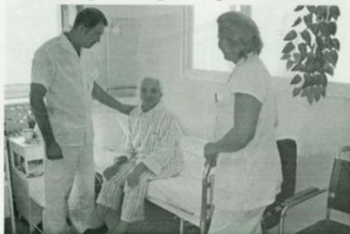
Ápolási vizit az osztályon

Az ápolási osztályon olyan betegeket kezelnek