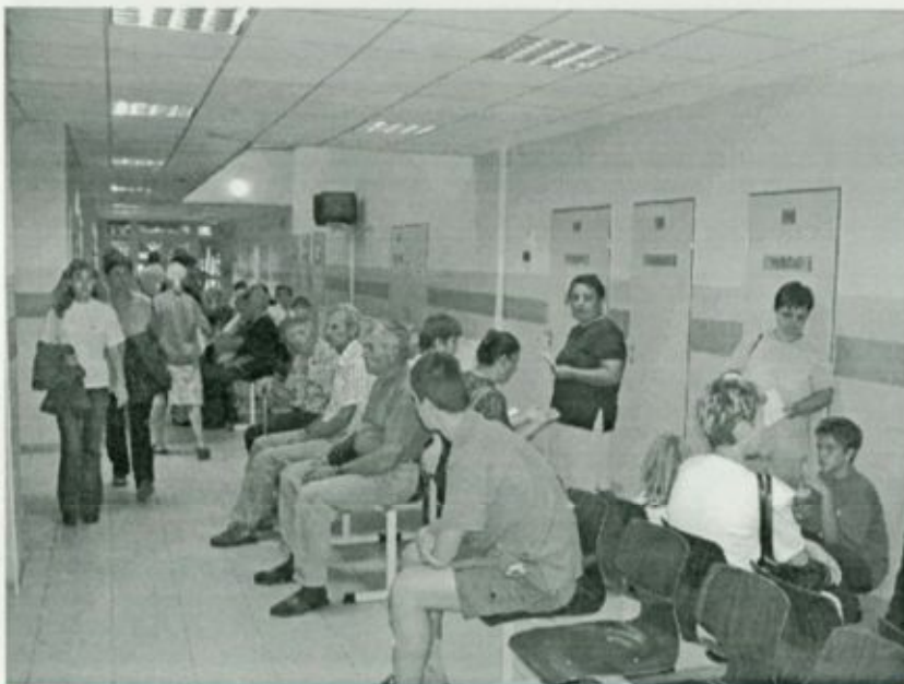
Betegek a fehérgyarmati szakrendelői szárny várójában

A rekonstrukciónak köszönhetően ma már mindkét városban minden rendelésen kulturált körülmények között, a lehető legmagasabb szintű technikai háttér igénybe vételével kerülhet sor a betegek vizsgálatára. A betegfelvételt, a várakozási idő csökkentését és az orvosi dokumentációhoz való folyamatos hozzáférést fejlett informatikai rendszer biztosítja. A betegdokumentáció elektronikusan történik, a szakrendelők között leletdokumentációs rendszer működik.