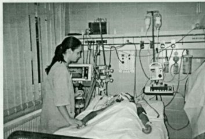
Életveszélyes állapotú beteg ellátása az intenzív osztályon

den ágyához tartozik a beteg életfunkcióit figyelő monitor, rendelkezésre állnak a legmagasabb színvonalat képviselő lélegeztető gépek, a központi oxigénellátó rendszerrel biztonságosan, higiénikusan és egyszerűen oldható meg a betegek ellátása.