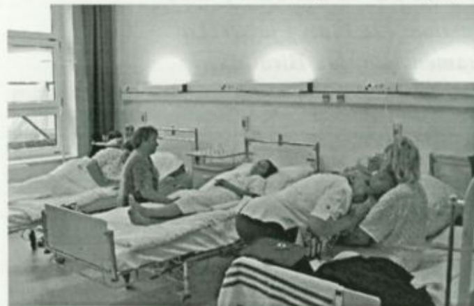
Betegek és látogatók a fül-orr-gége osztály egyik megújult kórtermében

A szakrendelőkben is magas szintű ellátást kapnak a betegek, a hagyományos vizsgálatok mellett mindkét telephelyen elvégezhető a komoly műszeres háttérrel igénylő fül-orr-gégészeti vizsgálatok és a hallásvizsgálatok is. Vásárosnaményban audiológiai állomás működik.