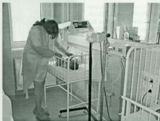
Kismama gyermekével a fehérgyarmati koraszülött osztályon