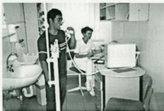
Legzeshumktios vizsgálat a fehérgyarmati Tüdőgondozó Intézetben

és saját forrás terhére. A bekerülő géppark a SEF kivételével újszerű, de nagy szükség lenne új szűrőberendezés beszerzésére, melyre a kórház pályázatot nyújtott be.