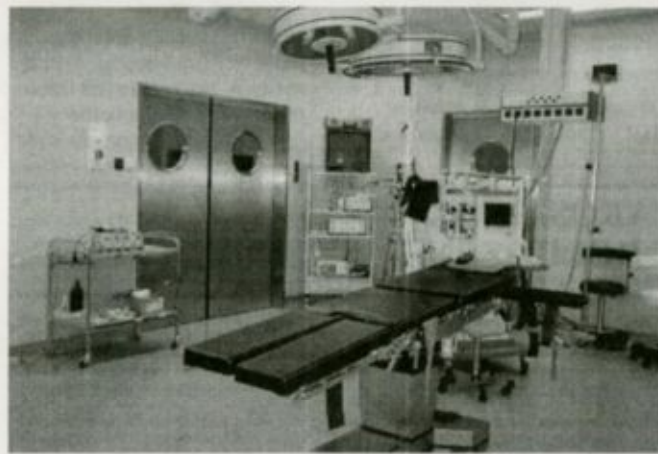
Modern műtő a fehérgyarmati új diagnosztikai és műtőblokkban

a debreceni egyetemi klinikán, vagy a Kenézy kórházban sem alkalmaztak. Ebben az igen jó eredménnyel elvégezhető és kíméletesebb műtési beavatkozásban az eltelt évek