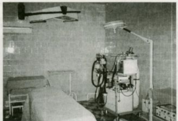
A fül-orr-gége osztály műtője

A szakrendelőkben is magas szintű ellátást kapnak a bete-