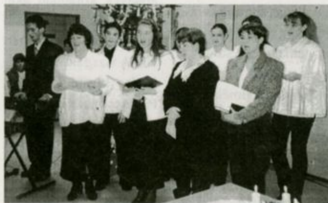
A tavalyi fehérgyarmati karácsonyi ünnepség egy pillanata

Az együttműködés említésre méltó része az is, hogy a Vöröskereszt által munkanélküliek számára szervezett 1700 órás, szociális gondozó-ápoló szakképzést adó tanfolyam résztvevői a gyakorlati ismeretek nagy részét a Szatmár-Beregi Kórházban, többek között a vásárosnaményi ápolási osztályon sajátíthatták el.