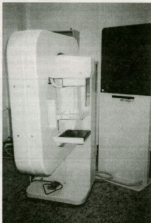
A mell vizsgálatát lehetővé tevő mammográf

A vizsgálatra előjegyzés kérhető a (06-44) 361-011/217-es telefonmelléken.