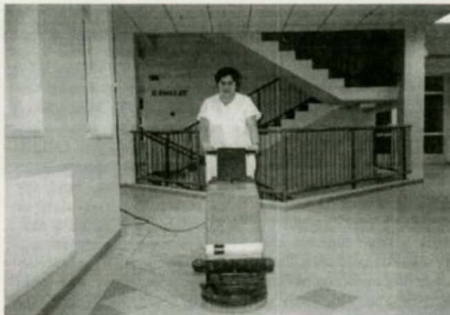
Munka közben az új épületben

römmel számolhatunk be arról, hogy a fehérgyarmati új diagnosztikai és mű-