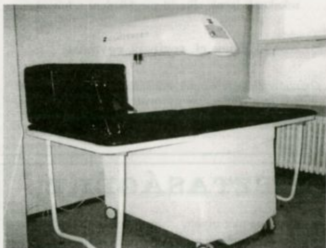
A csontsűrűség-mérő géppel időben felfedezhető a csonttritkulás