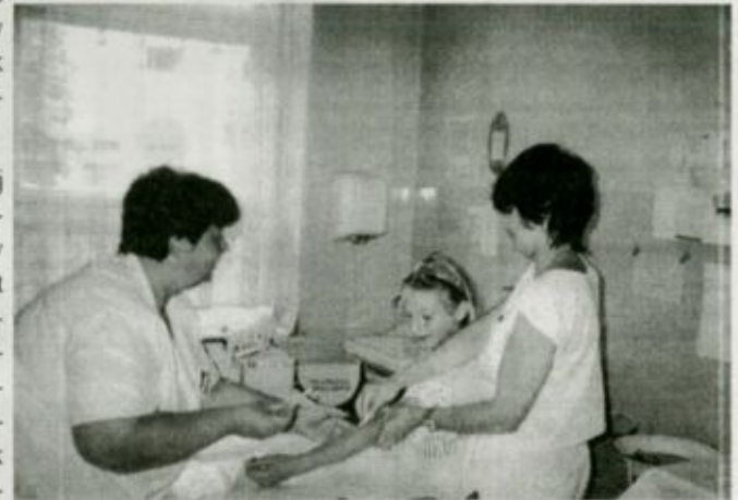
Vérvétel a gyermekosztályon.

ban már most is nagyon jók az ellátás körülményei, Fehérgyarmaton pedig