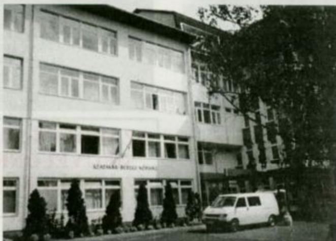
A vásárosnaményi kórházi egység főépülete

Míg manapság sok kórházban pusztán a betegségek gyógyítását tűzik célul maguk elé az orvosok, addig a Szatmár-Beregi Kórházban a beteget akarjuk meggyógyítani, akinek valamilyen betegsége van. Te-