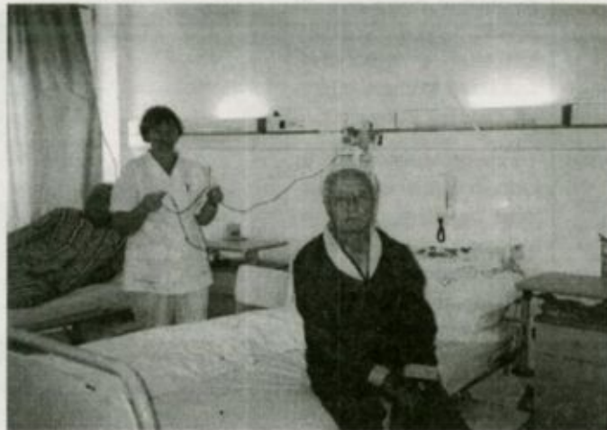
Betegek a vásárosnaményi belgyógyászati osztályon

A legtöbb beteg szív- és érrendszeri betegségekkel kerül a kórházba, de magas a