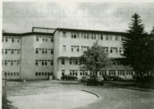
A fehérgyarmati új műtéti és diagnosztikai tömb

A kórház orvosai és szakdolgozói rendszeresen fejlesztik tudásukat, továbbképzéseken, kongresszusokon vesznek részt. Intézmé-