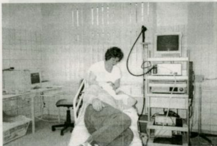
Felkészülés a gyomortükrözésre Fehérgyarmaton, a sürgősségi osztály területén elhelyezett endoszkópos vizsgáló helyiségben.

ben nem elegendő. Szükségessé válhatnak a gyomor, a vastagbél vagy a végbél olyan vizsgálatai, amelyek