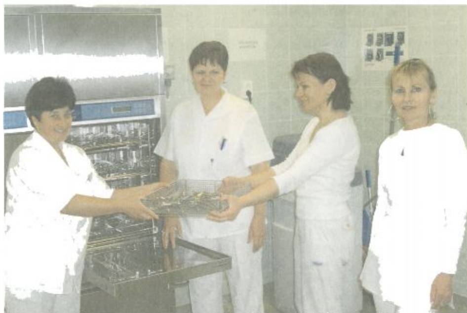
A kórház központi sterilizálójában