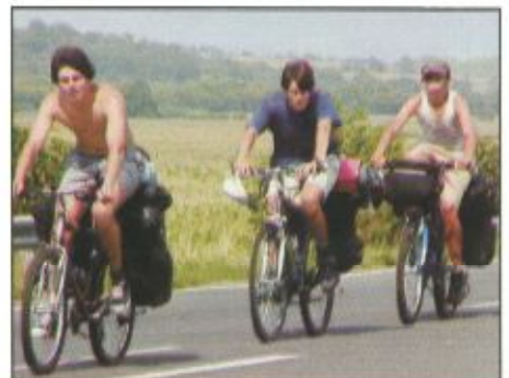
Egy lehetséges megoldás

A tudatos légzés is sokat segíthet. Az egyenletes légzés automatikusan csökkenti a stresszhormonok szintjét a szervezetünkben, mérsékli a szívverések gyakoriságát és csökkenti a vérnyomást.