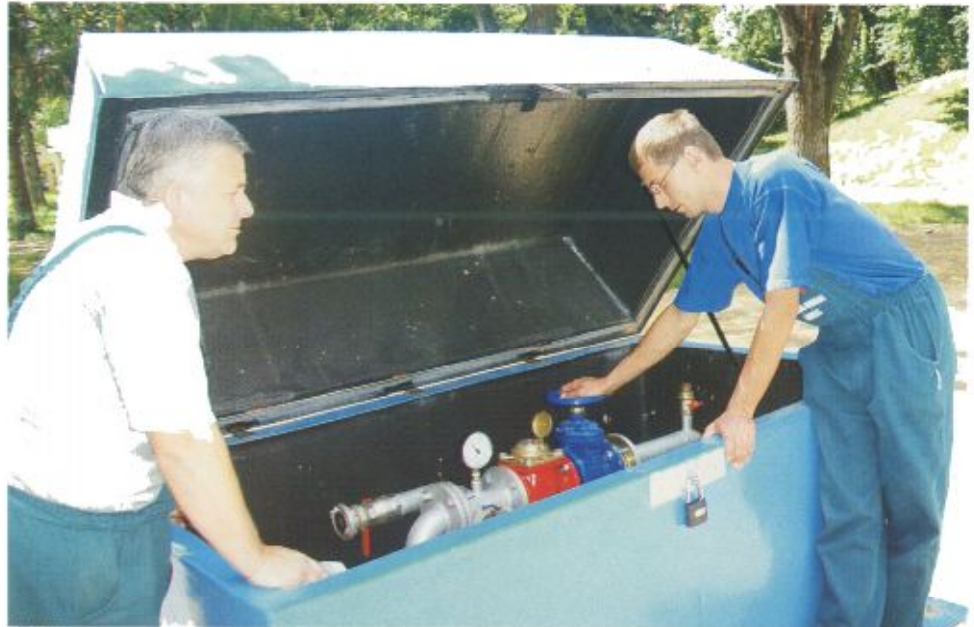
Elkészült a hévízkút

A városi strandfürdő termálvizének gyógyvízzé nyilvánításában a kórház aktívan részt vett, területén történt meg a klinikai kísérletek lefolytatása. A balneoterápiás pályázat készítésekor ismert volt, hogy az önkormányzat komoly fürdőfejlesztést tervez, amelyben a meglévő gyógyvízkút rekonstrukciója, valamint