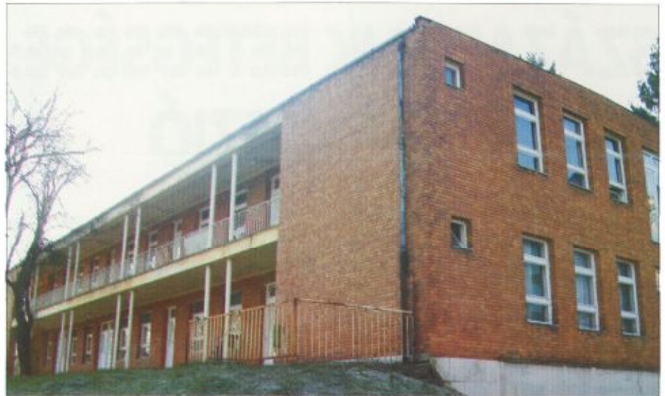
A régi fertőző osztály épületében kap helyet a rehabilitációs központ

A pályázattal megvalósítani kívánt projekt során a kórházban támaszkodva a fehérgyarmati gyógyvízre létrehoznak egy 80 ágyas speciális rehabilitációs osztályt. Az itt dolgozók az osztály profiljában a régióra is jellemző népbetegségek (cardio-cerebro-vasculáris esetek, mozgásszervi betegek) korai rehabilitá-