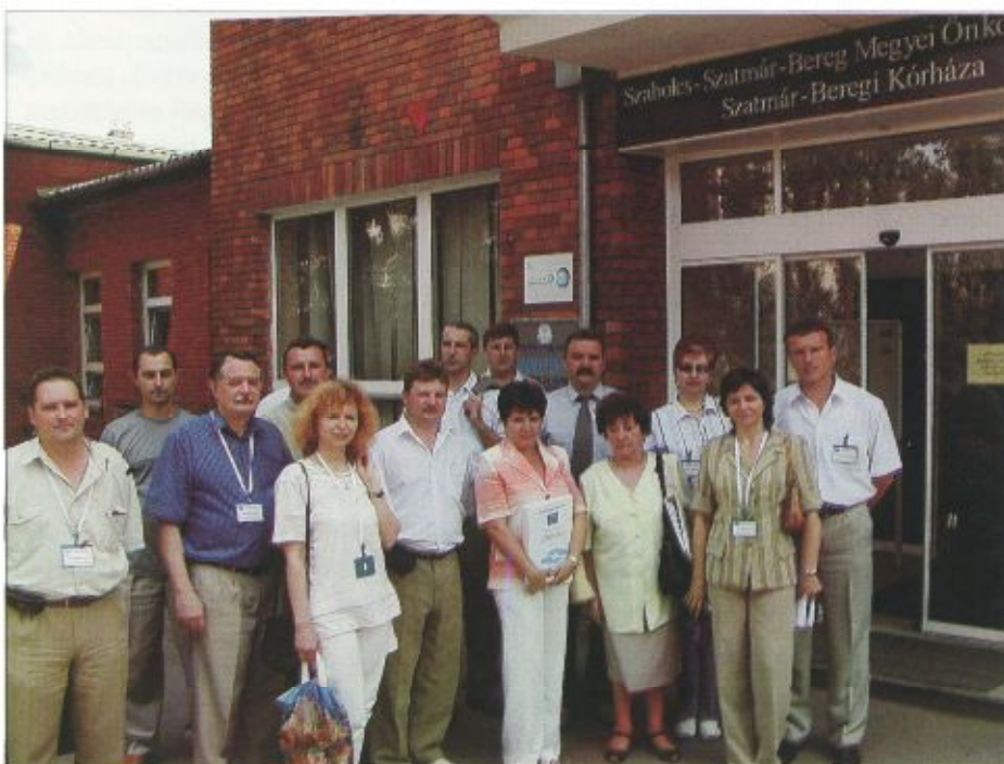
A program résztvevőinek egy csoportja

A megvalósítási szakaszban öt alkalommal tartanak továbbképzéseket az orvosok, illetve szintén öt alkalommal a szakdolgozók számára a fehérgyarmati intézményben. Az előadások a három kórház vezetői által jóváhagyott továbbképzési terv alapján folynak (mindenki kézhez kapta a tematikát), s ezeket a programban részt vevő egészségügyi intézmények orvosai illetve meghívott előadói tartják. A továbbképzés-sorozat a részvételt igazoló tanúsítványok kiosztásával, illetve az összegző értékelést magába foglaló Határmenti régiók egészségügyi dolgozóinak találkozója elnevezésű szakmai rendezvénnyel zárul október végén. Ekkorra várhatóan az egészségügyi szakemberek között kialakul a rendszeres szakmai együttműködés, a magyar és ukrán kórházak felvevő területein élő betegek számára elérhetőbb lesz az egészségügyi szolgáltatás, s az ellátásbeli különbségek is csökkennek.