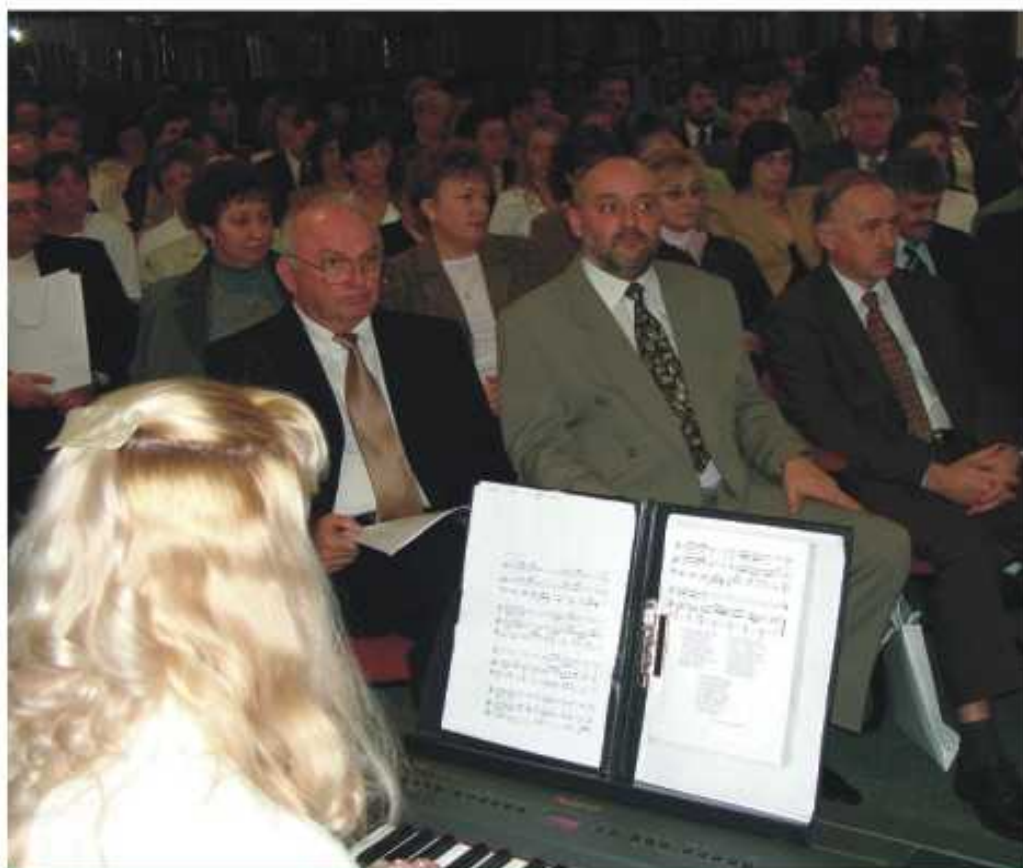
Az ünnepi műsor percei közben