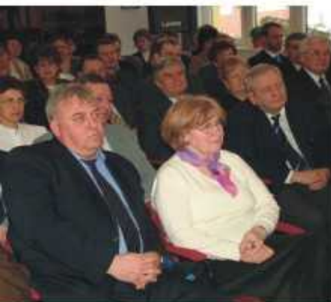
A meghívottak egy csoportja

betegellátás kórházi egységeit és a két telephely szakmai szolgáltatásainak egymásra épülésével, ágyszám leépítéssel, valamint a krónikus ellátás formáinak kialakításával optimalizálja a fekvőbeteg kapacitásokat. A gazdaságosabb működés érdekében központosították az igazgatási és szakmai, gazdasági, műszaki háttér-szolgáltatási feladatokat végzését. A szatmár-beregi térség mintegy 87 ezer lakosának járó- és fekvőbeteg-ellátását biztosító intézmény közös menedzsment irányítással, szakmai feladatmegosztással részben külön működik, viszont az egészségügyi és gazdasági-műszaki háttér-szolgáltatások összevonása teljes körűen megtörtént.