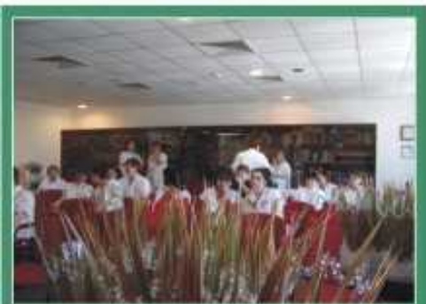
A hagyományoknak megfelelően idén is köszöntötték a hölgyeket a Szatmár-Beregi Kórház és Gyógyfürdő férfi dolgozói. Felvételünk az ünnepség előtti pillanatot idézi.

A tél folyamán megnövekedett vitamin és ásványianyag szükséglet miatt mostanra már kellőképpen kiürültek a szervezet tartalékai, ennek következtében levertség és fáradékonyság tapasztalható, jellemzőek az emésztési problémák, de a bőr állapota (fakó szín, pattanások, narancsbőr) is árulkodik. Mindehhez a szervezet lassult anyagcsereje miatt felgyülemlett mérgeanyagok is hozzájárulnak. Ezeket a mérgező salakanyagokat évente kétszer, össze és ilyenkor, tavasszal érdemes tudatosan kiűzni a sejtekből. A májat leginkább zöldség- és gyümölcslevekkel lehet felüdíteni, a bérendszer tisztításához rostban gazdag táplálékra és sok folyadékra van szükség. A tisztulást követően az emésztőtraktus megszabadul a salakanyagoktól, és gyorsabbá válik a tápanyagok felszívódása. A vese víz- és sóháztartást szabályozó funkcióját is fontos felélni, ehhez pedig ugyancsak bőséges folyadékfogyasztás szükséges (gyógy- és valódi gyümölcslevek, ásványvíz, zöldség- és gyümölcslevek). A tüdő mérgetelenítéséről sem szabad megfeledkezni. A szabadlevegőn végzett mozgás, séta vagy légyőgyakorlat a leghatékonyabb tüdőtisztító módszer, vagyis nincs mérgetelenítés sport nélkül.