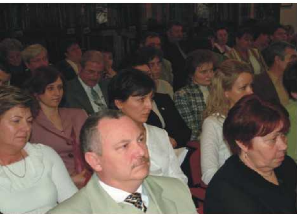
A kórház dolgozói és a vendégek

Az ünnepséget emléklapettek átadása zárta.