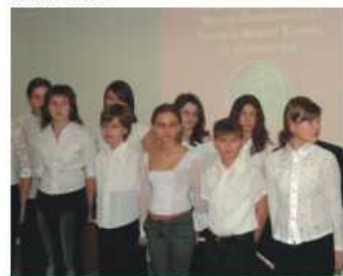
A műsorról a helyi Bárdos iskola tanulói gondoskodtak