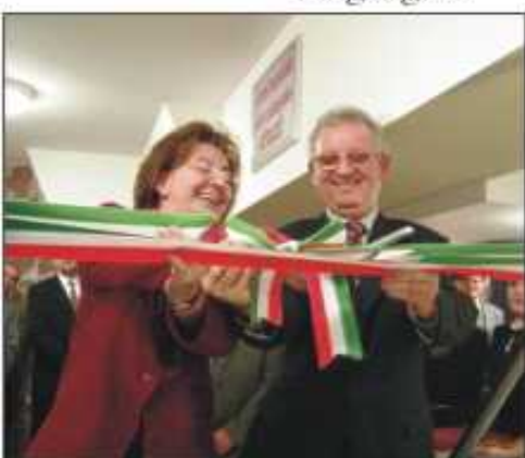
A gyógyfürdő ünnepélyes átadása