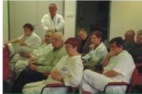
A hallgatóság egyik fele