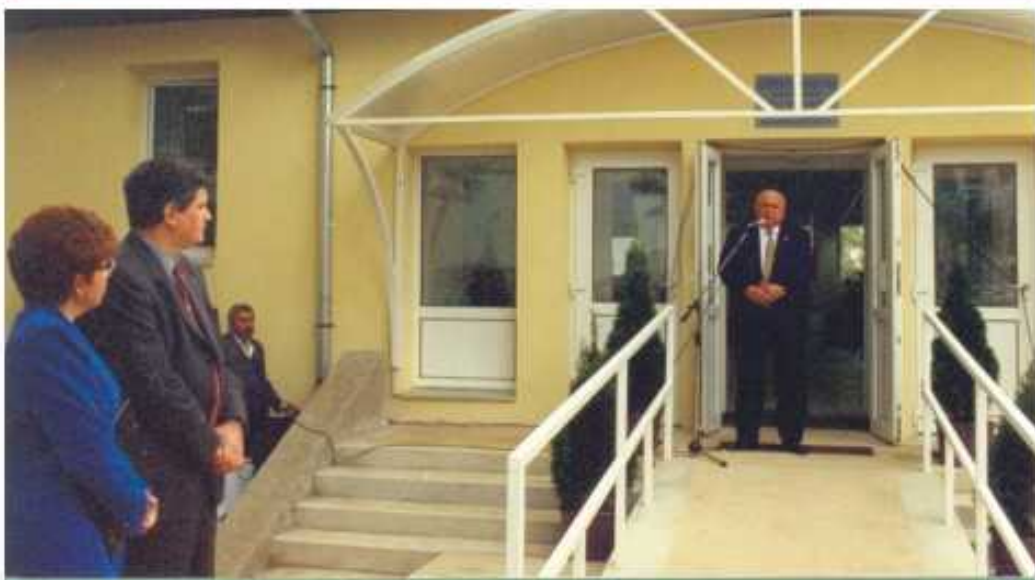
A vásárosnaményi szakrendelő épület átadása

A Szatmár-Beregi Kórházat 1996. február 23-án közgyűlési határozattal hozta létre a Szabolcs-Szatmár-Bereg Megyei Önkormányzat az addig önálló városi kórházként működő Fehérgyarmati Városi Kórház és Vásárosnaményi Városi Kórház egyesítésével, azok tulajdonbavételével.