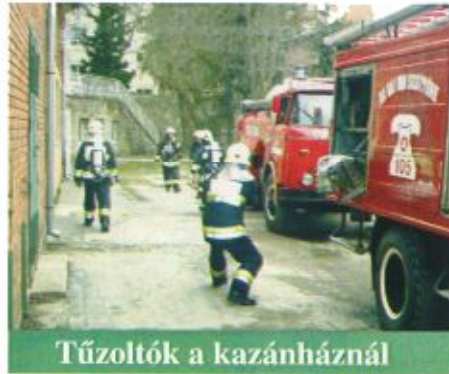
Tűzoltók a kazánháznál