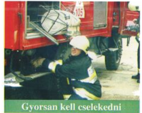
Gyorsan kell cselekedni

Emellett a tűzoltóság is tart bizonyos időközönként bejárásokat a kórház épületeiben - mivel az intézmény kiemelt létesítménynek számít. Az elméleti foglalkozásokat követően tűzoltógyakorlatot szerveznek, amelyen a tűzoltók mellett részt vesz a kórház személyzete is. A közelmúltban az újraalakult fehérgyarmati köztes-