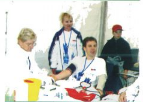
Csak mértünk, mértünk...

Hogyan lehet uniós támogatást szerezni beruházásokhoz, fejlesztésekhez, projektekhez? Erre a kérdésre kaptak választ mindazok, akik benéztek az EU-sátorba, ahol az Unió által támogatott sikeres pályázók mutatkoztak be és egy beszélgetés keretén belül elárulták a titkot. A program részeként felállítottak egy élő, internetes, ötállomásos játszóházat, ahol az érdeklődők kipróbálhatták, mennyire lennének sikeresek egy uniós pá-