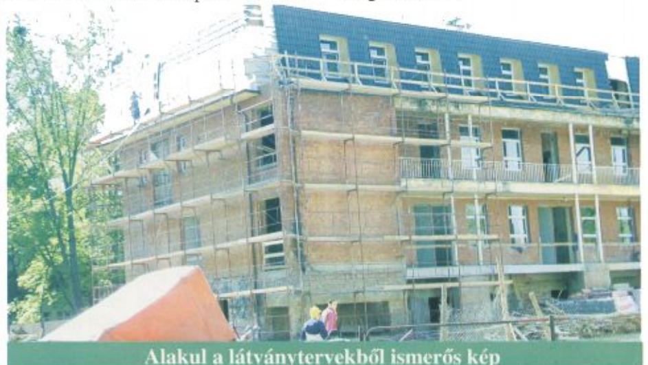
Alakul a látványtervekből ismerős kép