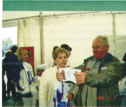
Adatleolvasás után tanácsadás

Magyarországon az Európai Unióból érkező források felhasználásával és a sikeres pályázatainknak köszönhetően több ezer fejlesztés kezdődhetett meg. Az elmúlt két év uniós sikereit bemutató találkozó jókedvű, sokszínű szórakoztató forgatag volt.