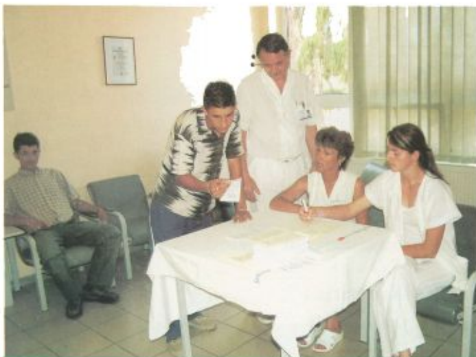
A recepciós pultnál sorra regisztrálták a jelentkezőket

A program sikeresen zárult, s kitűnt: a Szatmár-Beregi Kórház és Gyógyfürdő dolgozói a férfiak egészségét szűrővizsgálatokkal kívánják megvédeni, illetve tanácsaikkal a helyes életmódot, a sportolás fontosságát hirdetik.