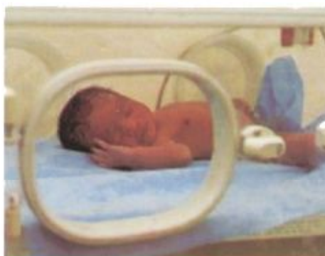
A koraszülött babákból a korszerű műszereknek is köszönhetően egészséges felnőtt válik, ők is növelik a népesség számát

A népesedési folyamatok ott alakulnak kedvezően, ahol nagyarányú a női foglalkoztatás, ahol erősek a nők szülés utáni mun-