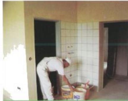
Előkészítés a festés előtt