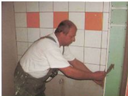
Alakul a végső kép

Az utolsó harmadába ért a rehabilitációs központ kialakításának kivitelezési munkálata: befejezéséhez közeledik a festés előtti előkészítő tevékenység és megkezdődött a hidegburkolás.