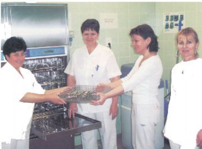
Az orvosi műszerek sterilizálását a kórház Központi sterilizálójában végzik

A Szatmár-Beregi Kórház és Gyógyfürdő kórházi háttérrel biztosít a rehabilitáció és gyógyfürdő szolgáltatások terén. Bővült tehát az ellátások köre, az orszámszintű csoportosítás lehetőségével és új szakrendelések bevezetésével. Ez utóbbiak közül kiemelhető a kardiológia, diabetológia, speciális nőgyógyászat szakrendelés és genetikai terhes UH vizsgálat, továbbá rehabilitáció és ortopédia, szakrendelések.