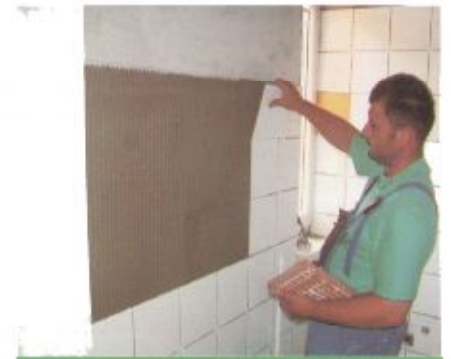
A tervek szerint haladnak