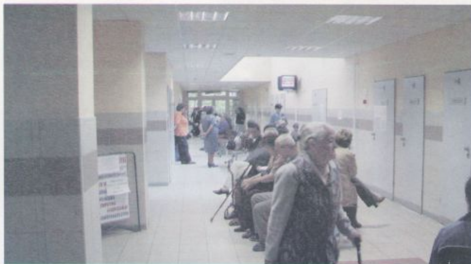
Rend és tisztaság jellemzi az intézményt

Elmondható, hogy a higiénés tevékenység keretén belül a megfelelő takarítási rendszer nagy jelentőséggel bír, s a betegellátás színvonalához is bár közvetve, de nagyban hozzájárul.