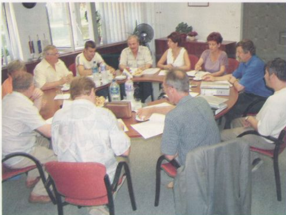
A záróértekezlet egy pillanata

A beruházás jelenlévő felelősei megtekintették a munkaterületet, s az ezt követő értékelésen megállapították, hogy a létesítmény a rendeltetésszerű használatra alkalmas. A hiányosságok feltárását követően megállapodtak a javításpótlás határidejében. A meghatározott napra, július 31-re a kivitelező a hiányosságokat megszüntette, s a műszaki átadás-átvételi eljárás befejeződött. A helyszíni bejáráson, majd az azt követő záróértekezleten részt vett: a Szatmár-Beregi