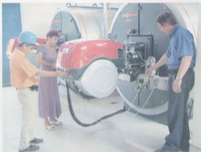
A műszaki átadás-átvétel közben