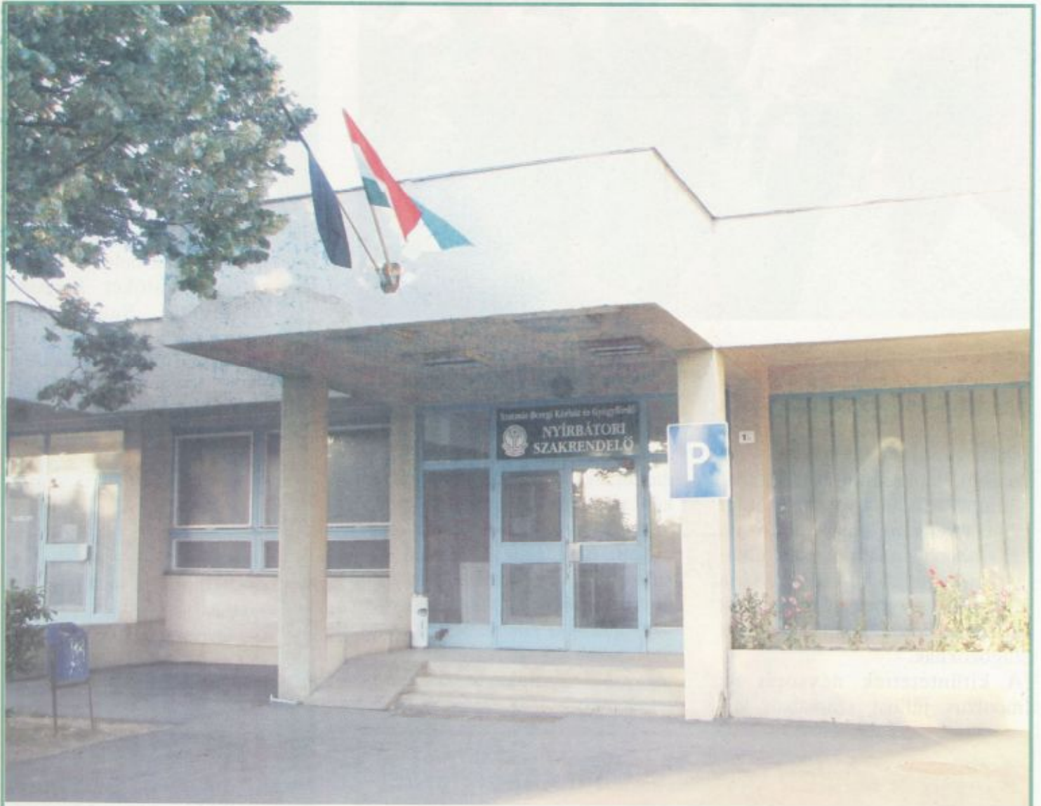
A Szatmár - Beregi Kórház és Gyógyfürdő működtetésével üzemel a Nyírbátori Szakrendelő

A SZATMÁR-BEREGI KÓRHÁZ ÉS GYÓGYFÜRDŐ LAPJA 2006. AUGUSZTUS-SZEPTEMBER