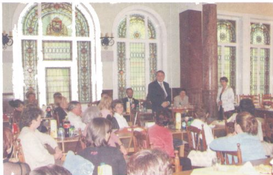
A tanácskozás közben

(Forrás: Bátor Újság szeptemberi száma, szerző: Leviczky Márta)