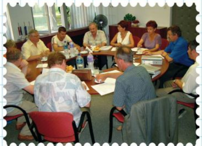
A záróértekezlet egy pillanata