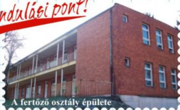
A fertőző osztály épülete