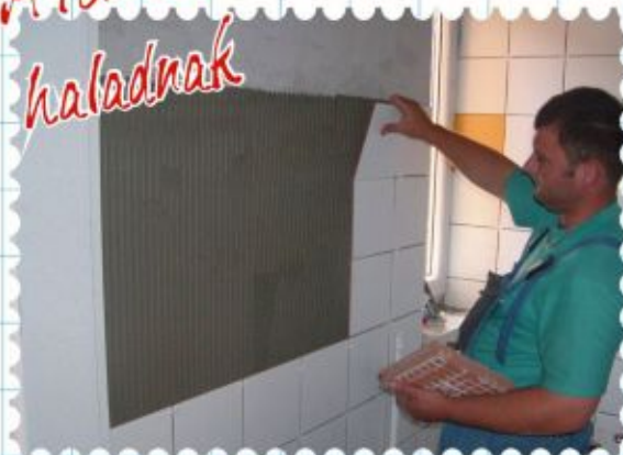
Alakul a végső kép