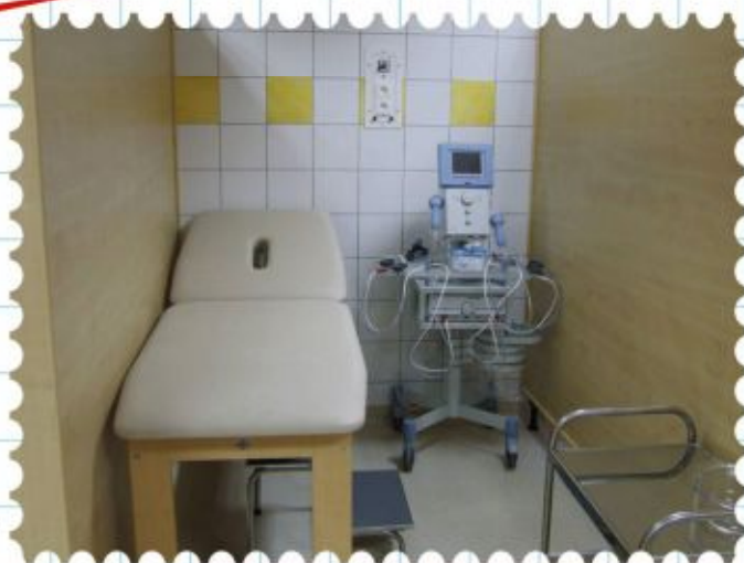
Elektroterápiás kezelő torony

DRÄGER Medical Kft., KORTEX Kft., Szamos-H Kft.