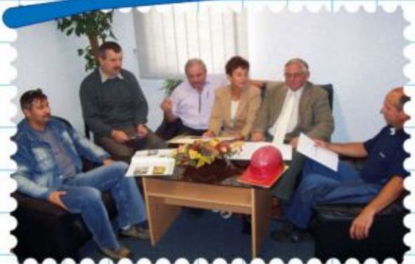
A beruházás felelőseinek egy csoportja

A projekt tervezett teljes költségvetése: