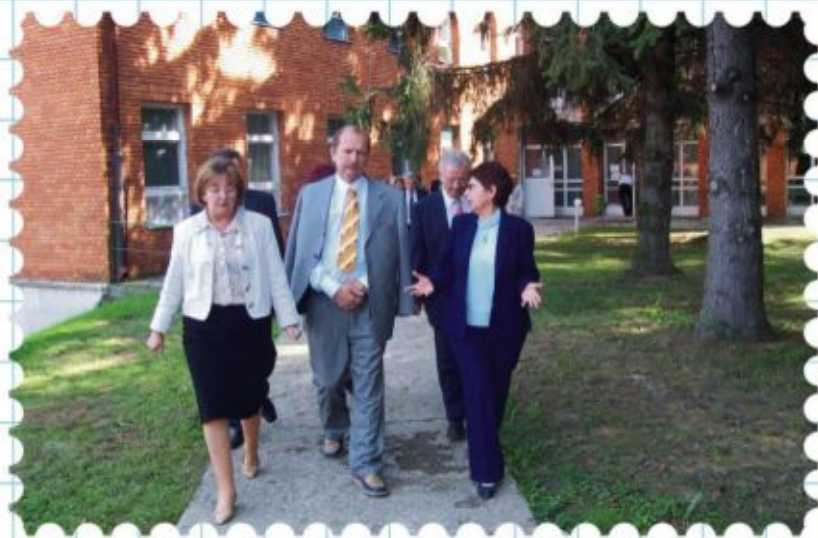
A miniszter elsők között tekintette meg az átalakuló létesítményt

tekintését követően, s hangsúlyozta, a komplex egészségügyi ellátást és országosan is egyedülálló szolgáltatásokat biztosító intézmény az egészségügyi létesítmények között példaként említhető.