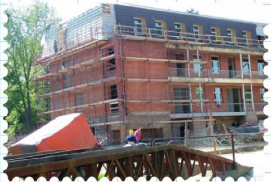
Elkészült a magastető, szépül a homlokzat

Már folynak a kooperációs egyeztetések a tervezővel, a lebonyolítóval és a kivitelezővel a legjobb megoldás kiválasztása érdekében.