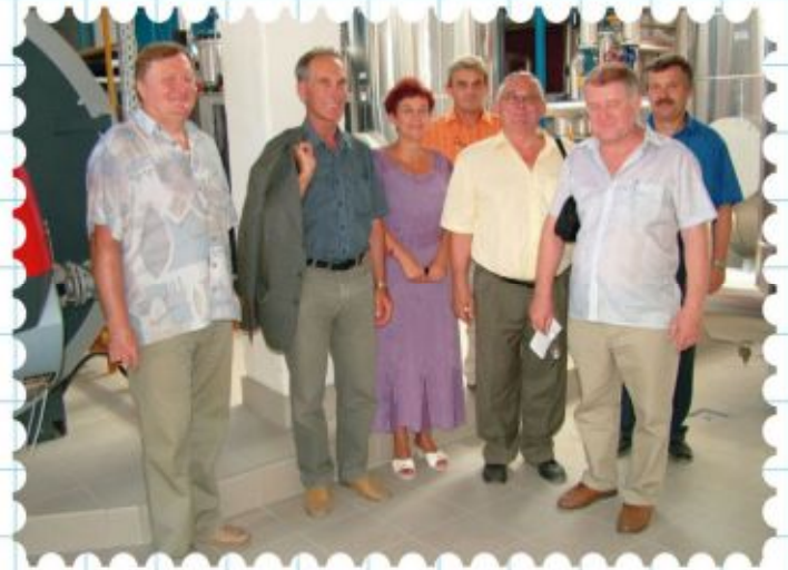
A helyszíni bejárás közben