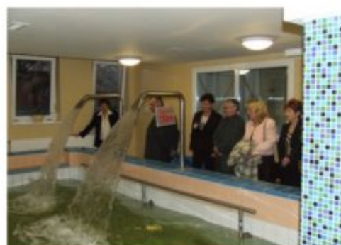
A gyógyfürdő szolgáltatásait is megtekintették

tájékoztatta a jelenlévőket. Elmondta: a rehabilitációs központban túlnyomórészt 2-3 ágyas, igényesen berendezett betegszobák vannak, magas komfortfokozattal. Az ambulancia és az alagsorban kialakított fizioterápiás kezelők, tornatermek korszerűen felszereltek és műszerezettek. Az épület zárt folyosón keresztül összekötésre került a kórház gyógyfürdőjével, ahol teljes körű fürdőgyógyászati kezeléseket vehetnek igénybe a beutaltak.