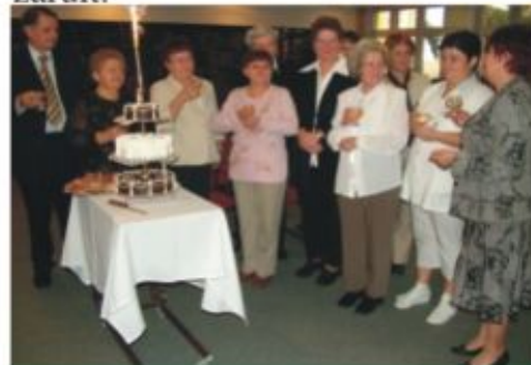
Tortával köszöntötték a jubilálókat

Az ünnepség a fehérgyarmati református egyházközség ifjúsági körének zenei előadásával, valamint a jubilálókat köszöntő torta és a karácsonyi hangulatot idéző diós, mákos kalács elfogyasztásával zárult.