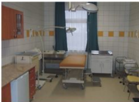
Korszerű körülmények várják a betegeket