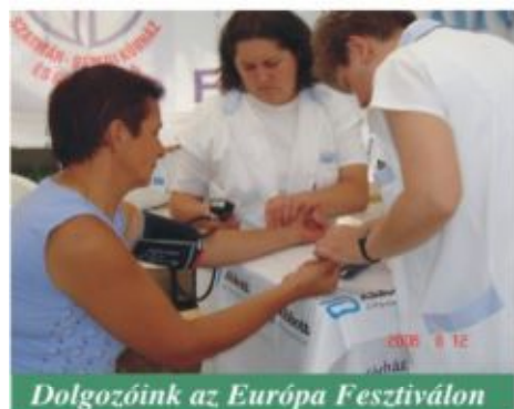
Dolgozóink az Európa Fesztiválon

A május 1-jétől hat napon át tartó budapesti Európa Fesztiválon bemutatkozott a Szatmár-Beregi Kórház és Gyógyfürdő. Az intézmény sátrában a jelenlévő dolgozók az egészséges életmód fontosságára, a szűrővizsgálatok jelentőségére hívták fel a figyelmet.