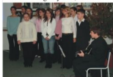
Az ünnepi műsort a református ifjúság adta

- Figyelmet igényel, hogy az egészségügyi dolgozók többsége munkával tölti az ünnepeket, amelyet nem lehet elégszer megköszönni hangsúlyozta, s mint el-