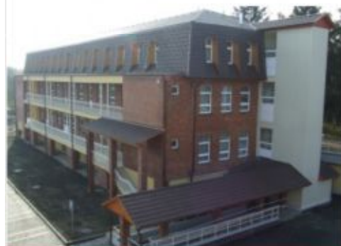
A tetszetős épületben megkezdődött a gyógyítás

A szakmai előnyökön túl a rehabilitációs osztály létrehozása munkaalkalmat is teremt a környékbeli lakosok számára.