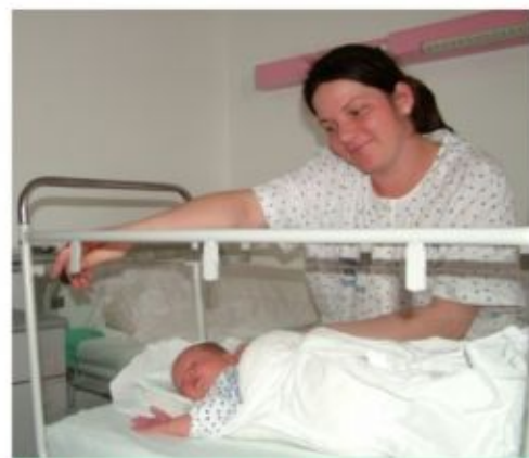
Egy kórteremben a baba és a mama

A Bababarát Kórház megtisztelő címmel büszkélkedhet a Szatmár-Beregi Kórház és Gyógyfürdő: az elismeréshez megyénkben egyedüli kórházként márciusban jutott az intézmény. A Szoptatást Támogató Nemzeti Bizottság és a Szerencsejáték Zrt. pályázati támogatása eredményeként az említett cím megszerzésével 500 ezer forint, valamint Korszerű szoptatási ismeretek címmel 18 órás továbbképzési lehetőség járt együtt. Mivel a Bababarát Kórház titulus elnyerésének feltételeként meghatározott 10 lépés többségének megfelelően történik a gyermekágyas részlegen az újszülöttek