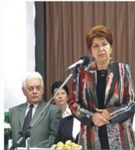
Az ünnepség egy pillanata