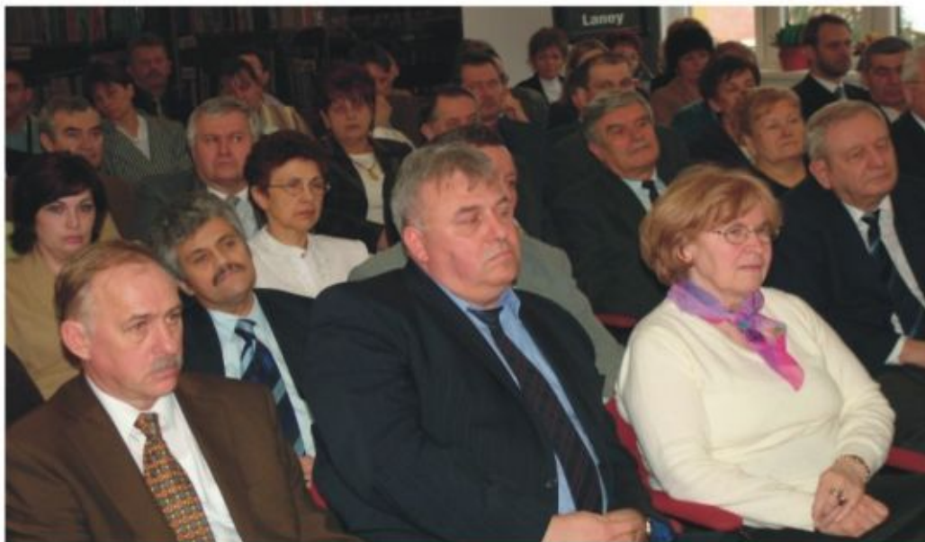
Az ünneplő közönség egy csoportja

Az ünnepséget a helyi iskolás gyerekek műsorát követően emléklapkettek átadása zárta.