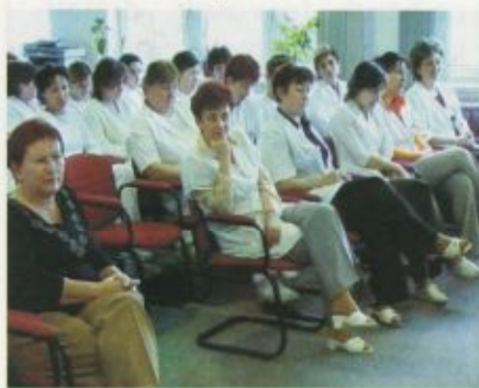
Az ünnepeltek egy csoportja