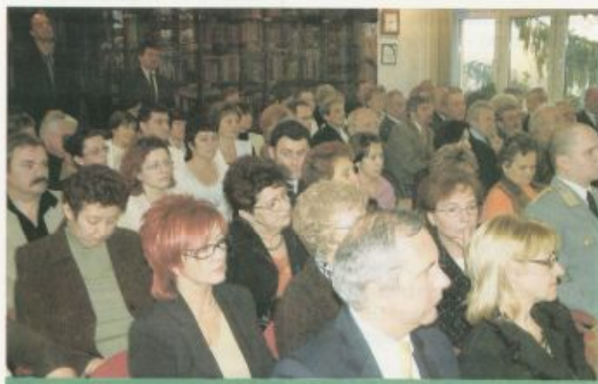
A meghívottak egy csoportja

Saját erő (kórház- megyel önkormány- zati): 56.511.873 Ft. (6,38 %)