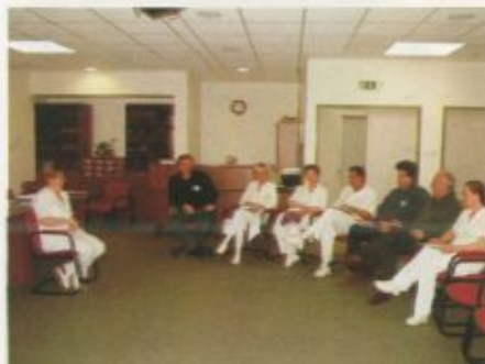
Az orvosoknak tartott tréning egy pillanata

- Sajnos egyre több az orvosokkal kapcsolatos per, s az elemzők értékeléséből kiderült: ezek többsége elkerülhető lenne a zökkenőmentesebb orvos-beteg kommunikáció esetén - fogalmazott a tréningvezető, majd kiegészítette: ez természetesen nem azt jelenti, hogy az