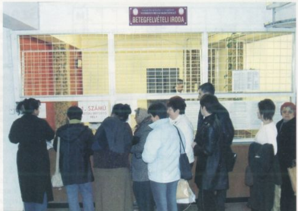
Nyírbátorban a betegfelvételi helyiségnél fizethető be a vizitdíj

Amennyiben a beutaló köteles szakrendelésekre nem hoznak beutalót, a beutaló adattartalma hiányos, vagy nem az adott szakren-