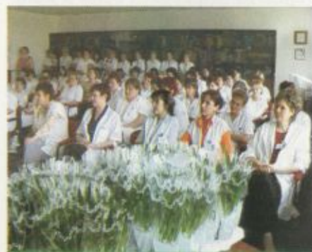
Az elmaradhatatlan virág és a hölgyek

A megemlékezés mindhárom helyen virágok átadásával zárult.