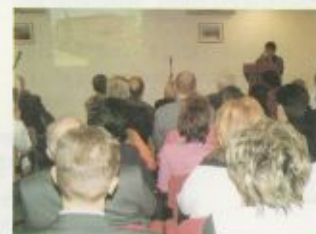
Film készült a megvalósítás folyamatáról

A projekt teljes költségvetése: 885.766.038 Ft.