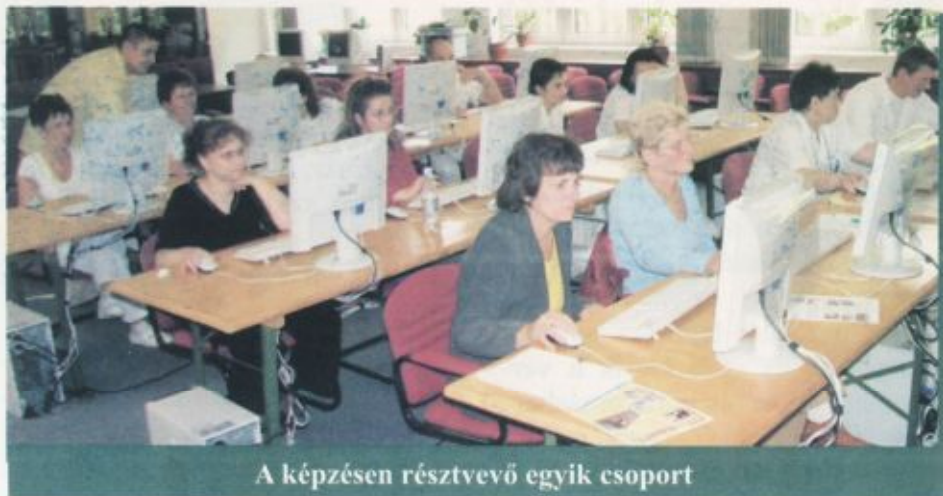
A képzésen résztvevő egyik csoport

Mivel az új program a Windows operációs rendszer alatt fut, elsőként ezzel ismerkedtek meg a tanfolyam résztvevői, majd az új rendszerről szereztek ismereteket.