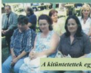
A kitüntetettek egy csoportja