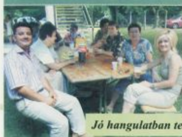
Jó hangulatban telt a nap