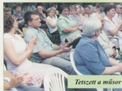
Tetszett a műsor