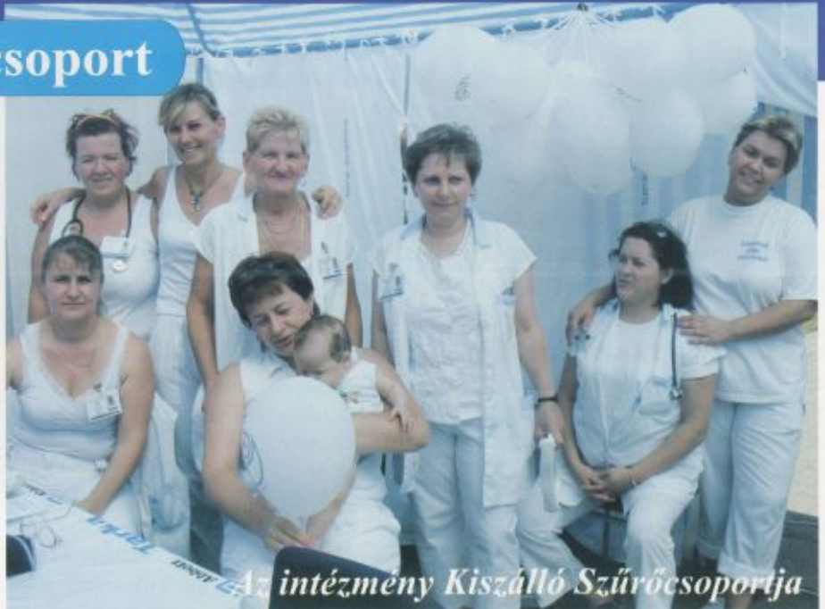
Az intézmény Kiszálló Szűrőcsoportja

A csoport önkéntes és odaadó munkájával évek óta szolgálja a környéken élők egészségmegőrzésének ügyét. Falunapokon, és a térség más rendezvényein is magas szintű szakmai felkészültségükkel bizonyítják az egészséges életmód és a betegségmegelőzés iránt érzett elkö-