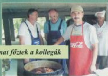
Finomat főztek a kollegák