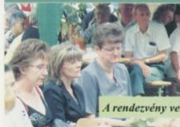
A rendezvény vendégei