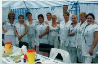
Milotán rekord szűrés-szám született