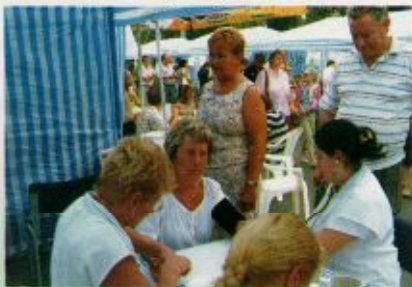
A szűrőcsoport a Gyarmati Vigasságokon

ban is, akik időnként csatlakoznak, vagy átveszik a feladatokat a saját területüket illetően. Gyakran száll ki a csoporttal gyógymasször, vagy más rehabilitációs munkatárs is, akik egy kellemes masszázssal vagy mágnesterápiás kezeléssel ajándékozzák meg az állapotfelmérést kérőket. Köszönjük továbbá a konyhai dolgozók munkáját, akik uticsomag készítésével gondoskodnak az egész napos ellátásunkról.