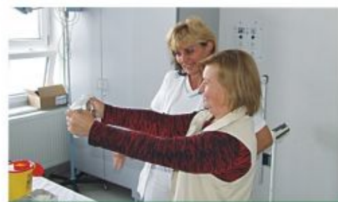
Nagy volt az érdeklődés

felmérő vizsgálatok mellett a szakrendelésekre jelentkezőknek sem kellett ezen a napon vizitdíjat fizetni. Az intézmény három telephelyén mintegy 150 érdeklődőt regisztráltak a dolgozók, s az alábbi vizsgálatokra volt lehetőség. Vérnyomás-, testsúly-, testmagasság-, vércukor-, vérkoleszterin, testsírszázalék mérés, vizeletvizsgálat, EKG, audiológia, nőgyógyászati rákszűrés, DEXA-vizsgálat, mamográfia, tüdőszűrés, szemészeti