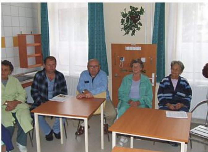
Csoportos diétás tanácsadás

A diétás előírások eleve az egészséges táplálkozás alapelveiből indulnak ki. Aki évek hosszú sora alatt helytelenül táplálkozott, illetve nem fordított gondot arra, hogy az étel, amit elfogyaszt, lehetőleg az egészségét szolgálja, annak kezdetben nehéz átállni az új ízekre, az új konyhatechnológiára, összetevőiben szemlélni az élelmiszereket, de kellő önfegyelmekkel és kitartással a siker biztosan nem marad el!