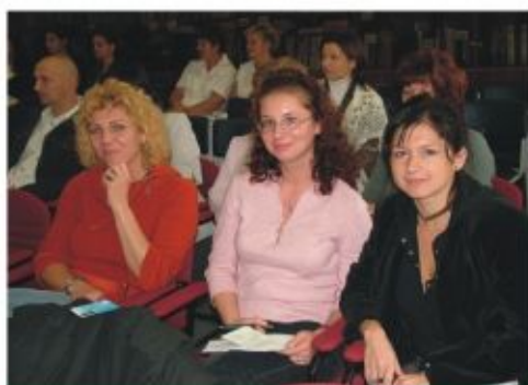
A hallgatóság tagjai