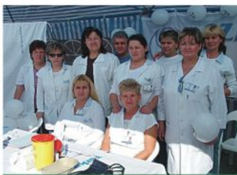
A kiszálló csoport Csengerben