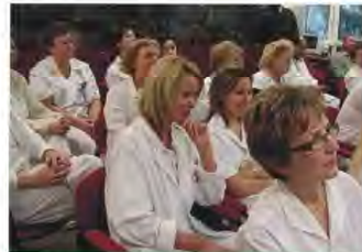
A fehérgyarmati dolgozók egy csoportja