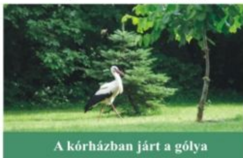
A kórházban járt a gólya