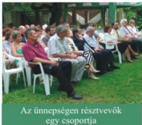
Az ünnepségen résztvevők egy csoportja

A rendezvényen a korábbi évek hagyományainak megfelelően kitüntetéseket adtak át a dolgozóknak, majd a Rege együttes versenyzés műsora szórakoztatta a jelenlévőket. A rendezvény hátralévő részében vacsorával látták