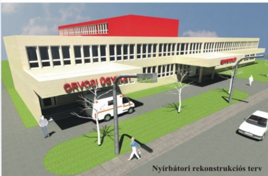
Nyírbátori rekonstrukciós terv

Az ügyeleti ellátással szoros szakmai együttműködéssel nappali kórházi ellátást biztosító egységet hoznak létre.