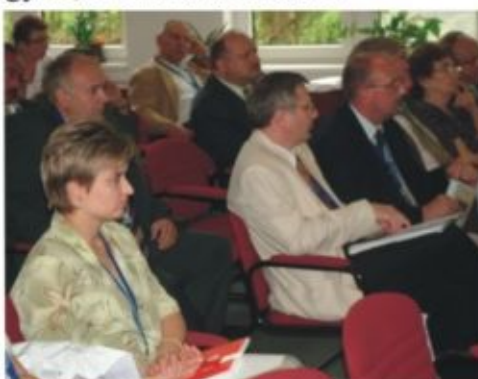
Sokakat érdekelt a rendezvény