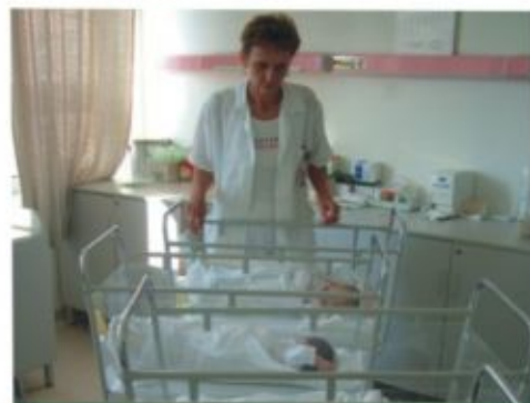
Újszülöttek a fehérgyarmati osztályon

A fehérgyarmati és vásárosnaményi körzetben évek óta szerveznek területi nőgyógyászati rákszűréseket - leggyakrabban a tüdőszűrésekkel együtt -, s a tavalyi évtől az intézményhez tartozó Nyírbátori Szakrendelő okán a nyírbátori kistérségben is. Országosan 7-8 %-os a behívottak részvétele, míg a Szatmár-Beregi Kórház és Gyógyfürdő