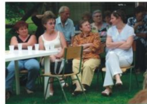
Aktív és nyugdíjas dolgozóink együtt

polgármestere, részt vettek az intézmény nyugdíjas dolgozói - akik évről évre ellátogatnak a találkozóra, ezzel is erősítve azt, hogy szeretettel gondolnak vissza munkatársaikra, munkahelyükre -, valamint a kórház fehérgyarmati székhelyének, vásárosnaményi telephelyének és nyírbátori szakrendelőjének munkatársai.