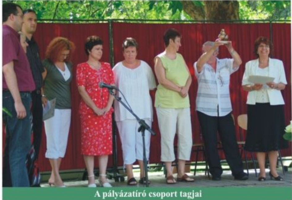
A pályázatíró csoport tagjai

nyek közül az eddig elért legmagasabb pontszámot érte el a kórház és nyerte el az Észak-Alföldi Minőségi Díjat. Gratulálunk a csoportnak!