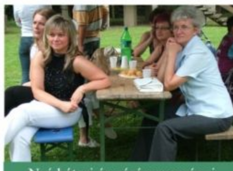
Nyírbátori és vásárosnaményi dolgozók az ünnepségen