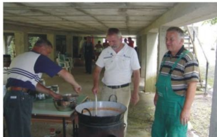
Készül az ünnepi ebéd a Semmelweis napon