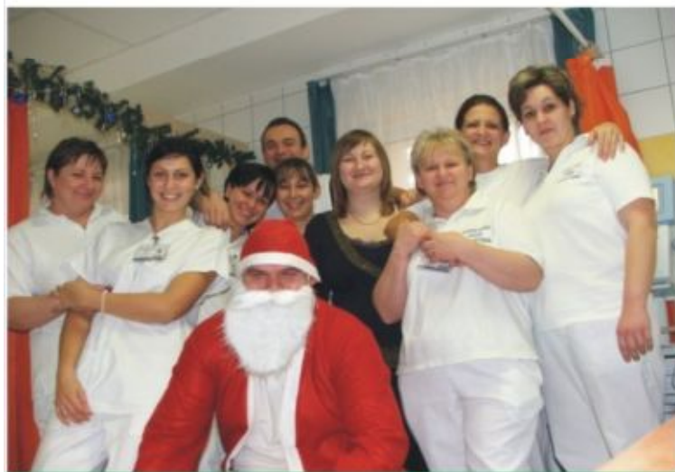
Mikulás járt a Rehabilitációs Központban