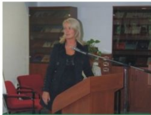
Major Zsuzsanna Gyógyfürdő vezető asszisztens előadása közben

A megnyitót követően a szakdolgozók előadásai következtek. Az előadások főképpen a fizioterápia, a rehabilitáció témájában hangzottak el. Új ismereteket szerezhetett a hallgatóság a pszichológus, a dietetikus, és a gyógyfürdő vezető asszisztens munkájáról is.