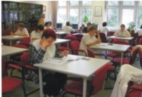
Vizsgáztak a takarítók