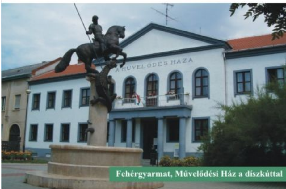
Fehérgyarmat, Művelődési Ház a díszkúttal