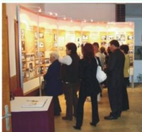
A kiállítás első látogatói