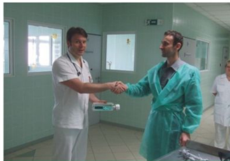
Új pulzoximéter készüléket kapott a Koraszülött részleg az „Egy szív a gyermekekért” alapítvány jóvoltából