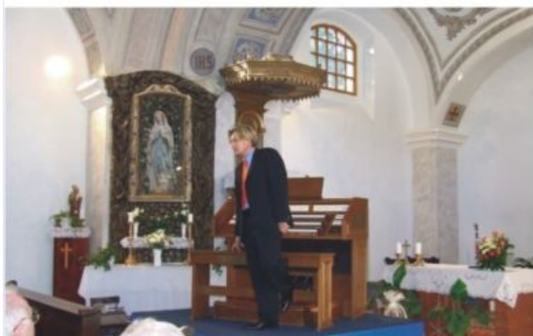
Varnus Xavér orgonaművész koncertje a Római Katolikus Templomban