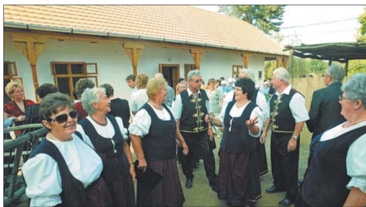
A régi lakóházból új közösségi tér jött létre

Nyírmada (KM) – A várossá válásukat ünneplő nyírmadaiak csütörtöktől városközpontjukkal is büszkélkedhetnek. A megújított díszburkolat, a park, az egységesek kapubejárók és utcabútorok elnyerték a helyiek tetszését. A korábban funkció nélküli, leromlott állapotú népi lakóházból új közösségi tér jött létre. A korhűen felújított épület, a hagyományos madai élet bemutatása mellett alkal-