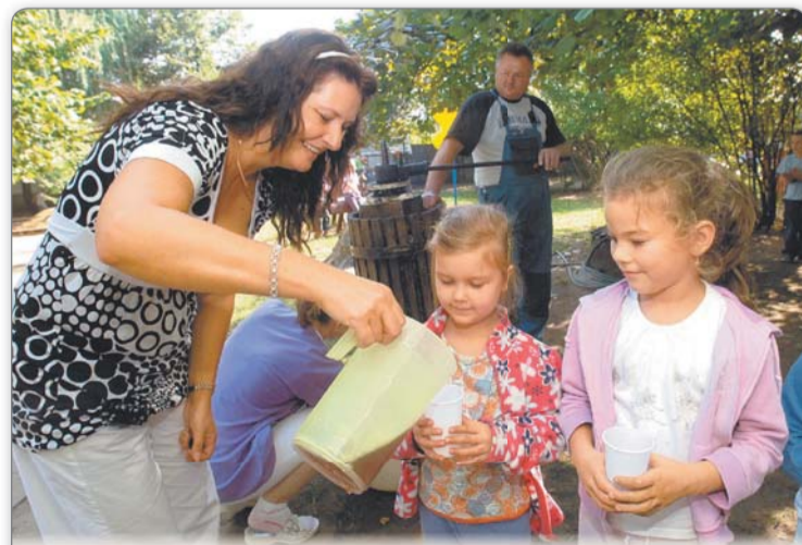
Must vagy soha. Szüreti kóstoló a nyíregyházi Búzaszem Óvodában.

A találkozó apropóján jelent meg Páll István Kelet-magyarországi tájházak című kiadványa.