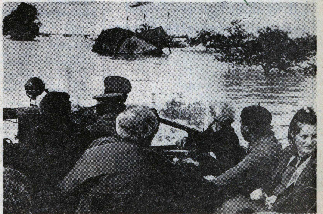
Kétéltevel Fehérgyarmat—Kisar között