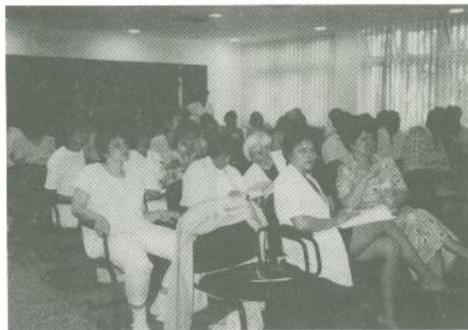
A május 24-én megtartott továbbképzés résztvevői