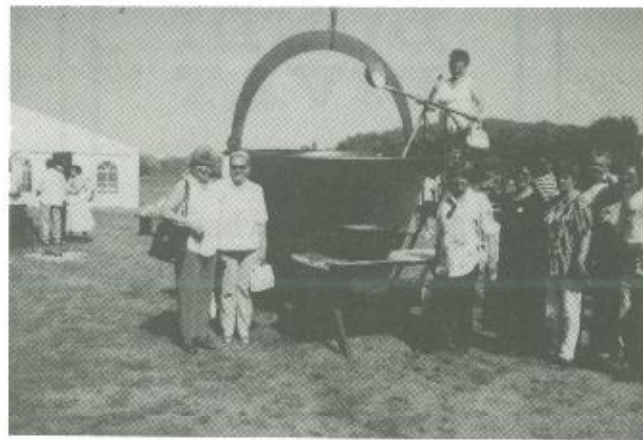
Ebédre várva az ötezer személyes bogrács előtt Ópusztaszeren

sari, a kölcsei, a tunyogmatolcsi általános iskola tanulói,